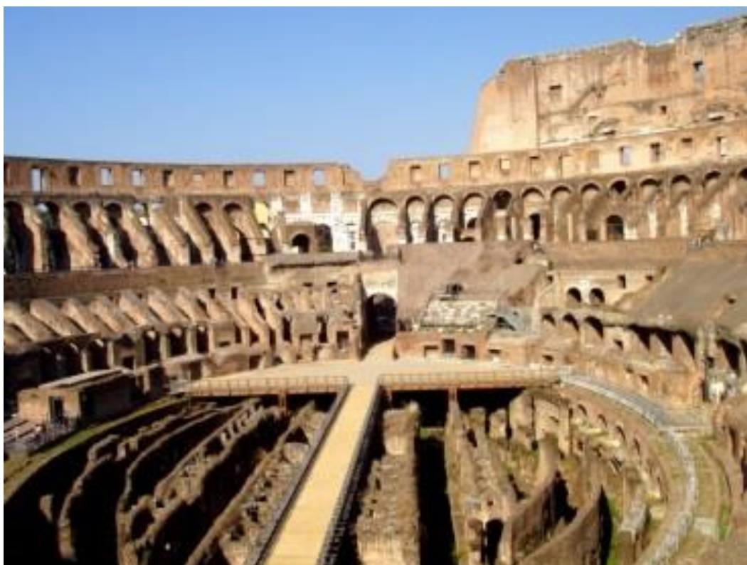
Fig. 2. Las ruinas del Coliseo Romano

A la Fuerza Invasora Alienígena le encanta jugar juegos. Ellos fueron los que establecieron el Coliseo romano, donde el público podía sentarse a una distancia segura, mientras que un grupo de personas eran sacrificadas a los leones en la arena, con la sangre salpicando en todas direcciones y con la gente gritando en agonía, mientras poco a poco eran comidos vivos. El público, por su parte, viendo este horrible escenario, gritaban animando en puro éxtasis, mientras que sus hermanos humanos eran asesinados ahí abajo!