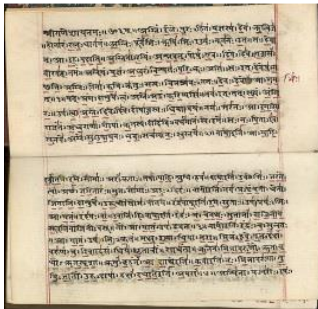
Fig. 4. sánscrito védico

Para una persona común, que no es un lingüista, puede parecer increíble cómo alguien puede hablar 30 idiomas, o más, con fluidez, pero así es como funciona. No estoy diciendo que es fácil -- por supuesto que no, pero es supuestamente cada vez más y más fácil.