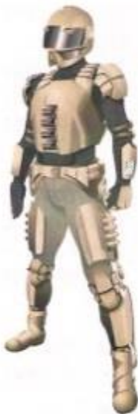
Figura 1. Supersoldado, modelo 2030 de DARPA.

Aunque las situaciones como éstas son malas, y, sin duda, reducen parte de la población mundial, también nos encontramos con que el genoma humano es fuerte -- ¡muy fuerte! Muchos cuerpos se adaptan a este tipo de radiación y sobreviven construyendo inmunidad a un mayor grado de radiación de lo que eran capaces antes. Esto es a la vez son buenas y malas noticias.