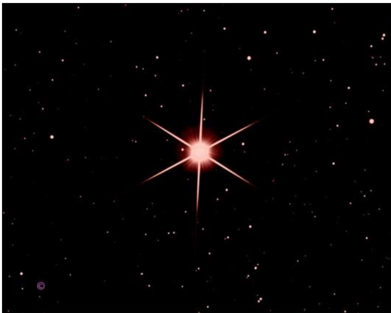
Fig. 4. Aldebarán, el sistema estelar de la Fuerza Invasora Alienígena .

En Wikipedia, tenemos una lista de los 27 nakshatras, donde, en este caso, se menciona Abhijit / Vega. En él se enumera a Brahma como la deidad que lo gobierna. [23] Entonces, si nos fijamos en nakshaktra # 4, Rohini es mencionado. [24] Rohini, como podemos ver, es "la roja", es decir, Aldebarán, que es \alpha Tauri, en las Pléyades. Esta estrella es incluso llamada Brāhmī , lo que indica su importancia para el escalón superior de la Fuerza Invasora Alienígena . En la columna de la derecha también nos dice que Brahma es el dios aquí. De hecho tal vez la base más importante de la Fuerza Invasora Alienígena desde la rebelión de Lucifer, es alfa-Tauri, la estrella roja gigante, Aldebaran!