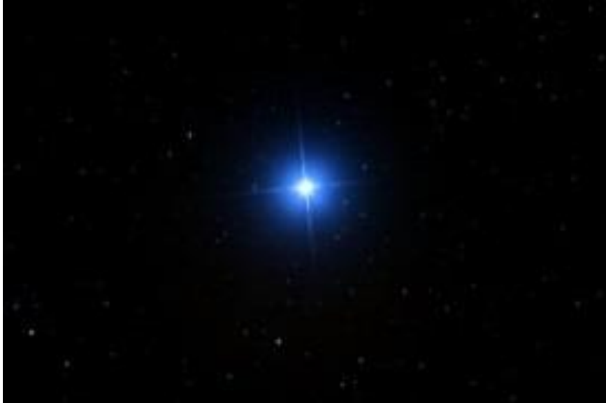
Fig. 3. Vega, el antiguo hogar de la raza Vulcano.

Me gustaría hablar de los vulcanos -- los ayudantes de Vega, que siempre estaban cerca de la Diosa Madre, y de hecho fueron sus "seres humanos primogénitos." A pesar de que eran mucho más altos que los humanos de hoy y tenían orejas puntiagudas y muchos diversos colores de piel algo diferente de la nuestra, ellos siguen siendo la plantilla humana en esta galaxia.