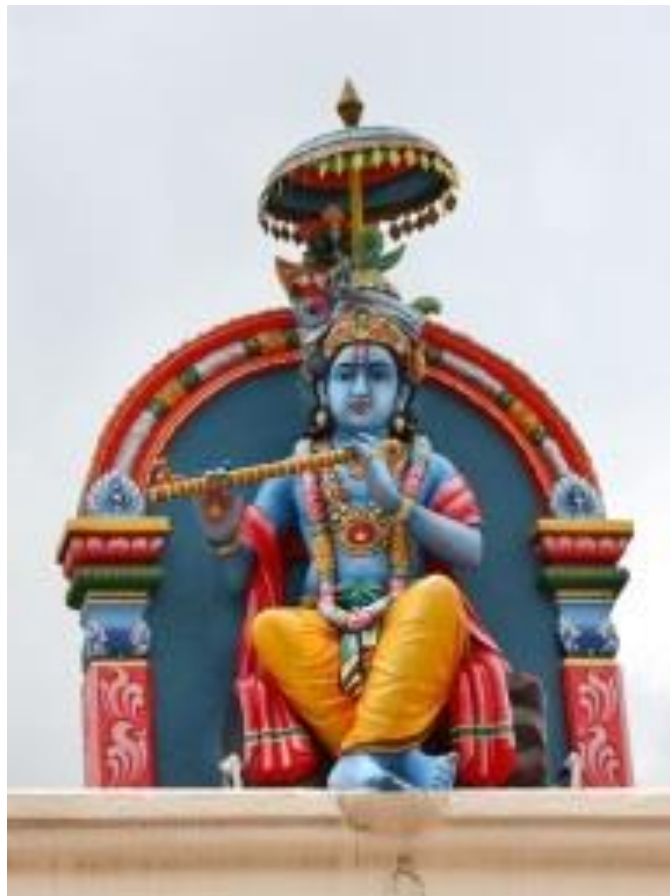
Fig. 2. El Señor Krishna

Ahora, si empezamos a interpretar el pasaje anterior, el Señor En.ki y Señor Marduk tomaron cuerpos humanos y "aparecieron en este mundo como monarcas, dotados de gran fuerza, [...] listos para aplastar a los que se oponían a ellos." Así se convirtieron en los nuevos gobernantes, de los cuales a menudo leemos en nuestra historia -- reyes que a menudo gobernaron con mano de hierro. Cuando aprendemos acerca de que estos reyes, faraones, o quienquiera que fueran aparecían como en nuestros libros de historia, se nos enseñó que estos gobernantes eran seres humanos, por supuesto, pero eso no es siempre el caso sólo porque tienen un cuerpo humano. Muchos de los reyes y faraones de Egipto antiguo sin duda eran los mismos dioses, gobernando sobre el pueblo.