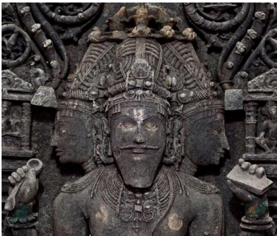
Fig. 1. Escultura de Brahma.

Según los Vedas, Brahma es el "Dios auto-existente", quien es considerado el progenitor de todos los seres vivos en el universo material . El origen de Brahma es trascendental, y él carece de padres materiales. Así, se dice que es auto-existente. Bajo él se encuentran los Devas, los cuales discutiremos mucho más en un próximo artículo, y ellos son considerados inmortales porque viven millones de años. Los Devas son, lo que nosotros consideraríamos seres no físicos, o interdimensionales. Todos los seres encarnados en el universo material tienen una vida finita, sin embargo, que se diferencia de una raza a otra, y de planeta en planeta, pero todos esos seres (donde se incluyen los humanos) tienen que morir en algún momento.