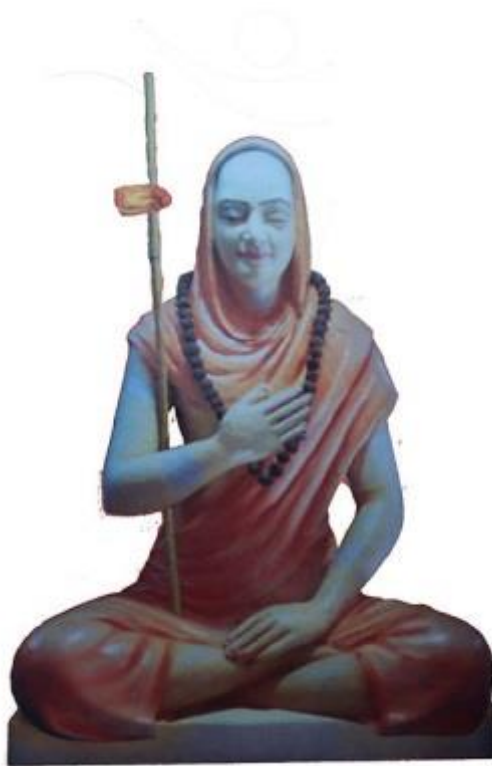
Fig. 2. Adi Guru Shri Gaudapadacharya, el gran gurú de Sri Adi Shankaracharya y el primer defensor histórico de Advaita Vedanta. ( https://es.wikipedia.org/wiki/Advaita ).

En el Vedanta Advaita indio, [12] se les enseña que el objetivo final es el de integrar el ego individual en el Brahman, que es la Divinidad. Esta escuela de enseñanza sigue las enseñanzas védicas tradicionales, lo que significa que enseña la idea de que un individuo transmigra a través de una jerarquía celestial de reinos habitados (dimensiones) -- desde la materia 3-D sólida, a través de más reinos etéreos hasta que llegan al Reino de Brahma , donde se unen con el Brahman, el Dios Único. Además, tanto Advaita Vedanta y otros textos védicos, sostienen que todos estos reinos son ilusorios y nada existe sino La Conciencia, es decir, el Brahman.