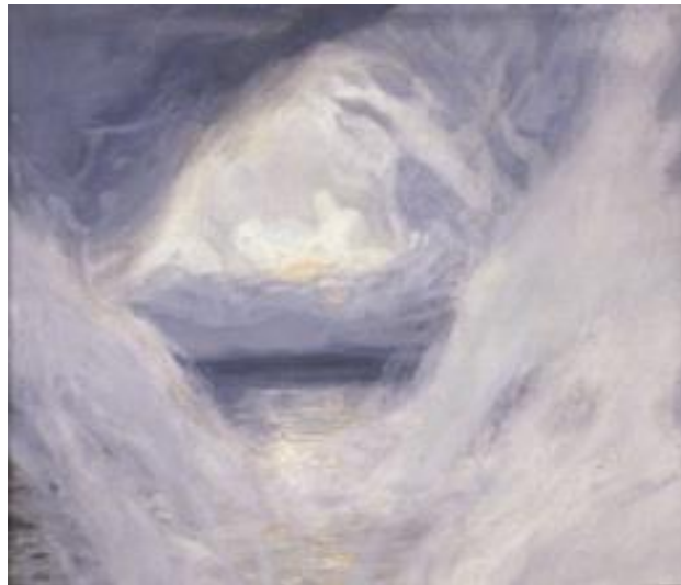
Fig. 3. El comienzo del diluvio (interpretación del artista)

La diosa se quejó amargamente por deficiencias del príncipe EN.LIL como tomadores de decisiones del Padre EN.LIL (y el Príncipe (Ninurta aparentemente se había puesto del lado de su padre cuando llegó a inundar el planeta). Ella lloró cuando vio a los seres humanos muertos "obstruyendo el río como libélulas." Ella juró "por las moscas en su collar" que ella nunca olvidaría el Diluvio.