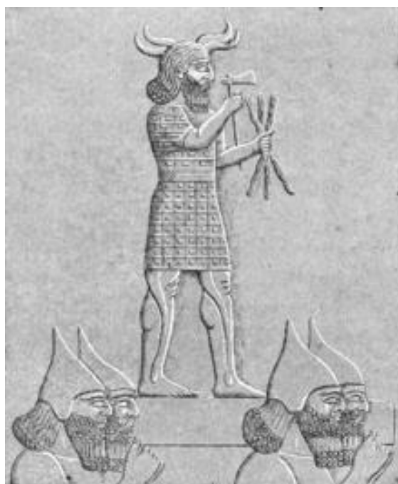
Fig. 2. Adad

Unos 1,200 años más tarde, según estos mismos registros, el hombre se había multiplicado de nuevo a tal punto que comenzó a preocupar a Khan EN.LIL. En esta ocasión se decidió por una sequía para reducir su número. Por lo tanto dejó que el "dios-trueno de la lluvia," Adad, se detuviera y detuviera las lluvias, por lo que la tierra se quedó sin agua y se secó. Una vez más, Utnapishtim vino a En.ki a pedir consejo, y de nuevo, En.ki le dio el mismo consejo como lo hizo antes y le dijo que le dijera a la gente que adorara al único dios que está frenando las lluvias. [9] Adad, al igual que Namtar, se avergonzó y dejó que las lluvias comenzaran a caer de nuevo.