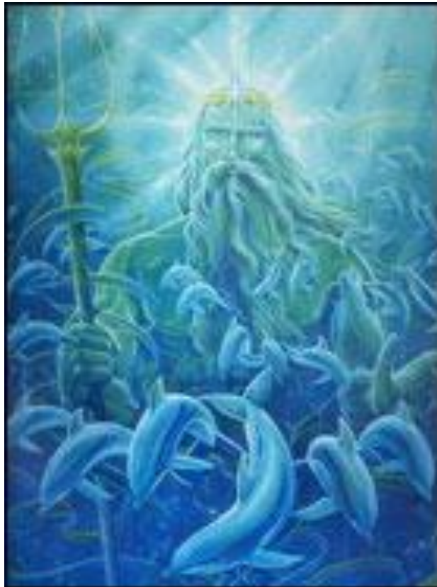
Fig.4. En.ki y Neptuno / Poseidón

¿Cómo es esto posible? Bueno, vamos a ir hacia atrás y veamos lo que realmente ha pasado aquí. Khan EN.LIL, a pesar que otras razas estelares deseaban terminar a la humanidad, quería evitar que esto sucediera. En cambio, se decidió por el control de la población. En.ki, que se había cansado de lo que él había creado y quería empezar desde el principio otra vez, vio todo esto como una gran oportunidad. Por lo tanto, él sabotó todos los esfuerzos del Consejo de Orión para salvar a la mayoría de la humanidad. En.ki sabía que si su plan fuera exitoso, el Consejo, finalmente, tendría que ceder a la presión de otras razas estelares y, de hecho, tendría que poner fin a la humanidad de una vez por todas. Así, cuando todos los intentos del Consejo habían fracasado porque En.ki sabotó sus planes, se les ocurrió la idea de un diluvio. En.ki probablemente saltó de alegría al oír eso, pero mantuvo la cara seria. En cambio, dijo algo en el sentido: "¿Qué Diluvio? Ni siquiera sé lo que estás hablando. Esto es algo para que lo instigue EN.LIL -- no yo! "Por lo tanto, se juró a sí mismo libre de esta decisión, fingiendo que no quería tener nada que ver con eso, aunque secretamente lo hizo, y desde entonces ha sido visto como amigo de la humanidad.