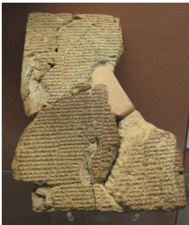
Fig. 1. Las tabletas Atrahasis

Como podemos ver, no soy el único en ver a través del carácter manipulador y horrible de En.ki. Es fácil para En.ki hacer ver a Khan EN.LIL como un monstruo, con el diluvio como una justificación para hacerlo. El problema que normalmente tenemos cuando estamos hablando de estos dioses es que estamos basando nuestro conocimiento sobre los registros que fueron escritos por escribas, que a su vez, eran sacerdotes en la jerarquía de En.ki. Si usted fuera En.ki, ¿nos diría la verdad? Por supuesto que no, ¿por qué lo haría? Sería contradecir su agenda.