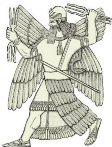
Fig. 5. Príncipe Ninurta

Estas ideas son muy interesantes, y algunos de los eventos pueden haber ocurrido como parte del plan, pero la pregunta es lo que realmente sucedió durante el Diluvio, y lo que sucedió después, algo que vamos a ver en el próximo artículo. En los tiempos post-diluvianos poco después del Diluvio, En.ki y su hijo hicieron cambios drásticos en la posición de la Tierra en el sistema solar. Curiosamente, las leyendas rabínicas parecen haber recogido esto.