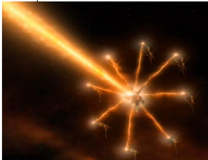
Fig. 6. Arma Interdimensional de destrucción masiva