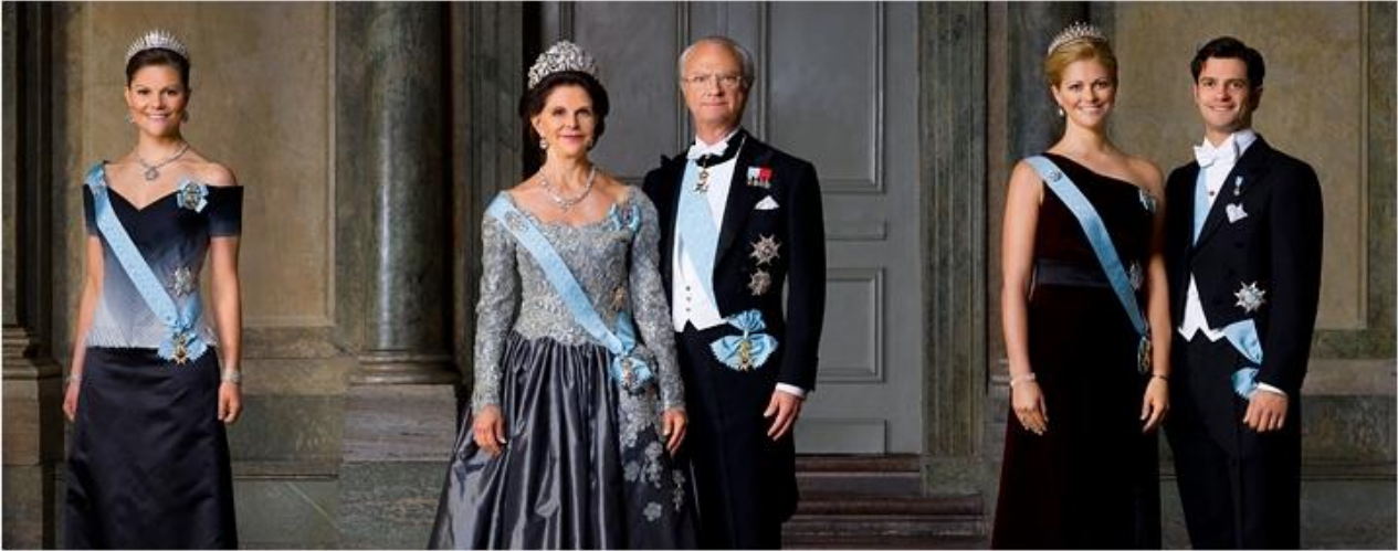
Fig. 3. La actual familia real sueca. La reina Silvia y el rey Carlos Gustavo XVI están retratados en el medio, y la Princesa Victoria está a la izquierda. La princesa Magdalena y el príncipe Carl Philip están de pie a la derecha.

una línea de sangre muy pura para servirle. La endogamia era la solución para que se mantuvieran en el poder. Hasta este día, la Elite Global practican la endogamia, e incluso está saliendo en los principales medios de comunicación ahora cómo la gente en el poder, que parecen totalmente ajenos en términos genéticos, tienen antepasados comunes. También podemos ver claramente este patrón entre las familias reales del mundo, que nunca dejan que sus hijos se casen con alguien que no es de la línea de sangre.