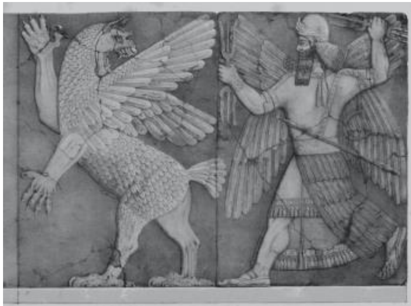
Fig. 5. "Ninurta lucha y derrota a Zu, el águila con cabeza de león, es decir, el grifo ".

En segundo lugar, ¿quién es Zu? En el viejo mito, Zu es representado como un gigantesco ser pájaro [14] , que puede respirar fuego y agua, lo que me parece interesante, hablamos antes sobre la Tribu Pájaro, y de cómo la gente de Lucifer es asociada principalmente con los pájaros y el agua (seres acuáticos). Zu también es a veces visto como un águila con cabeza de león (un "grifo"). [15] Esto lo podemos ver representado en un antiguo artefacto. En la fig. 5 de abajo, podemos ver a Ninurta luchar y derrotar a Zu, el águila con cabeza de león, es decir, el grifo .