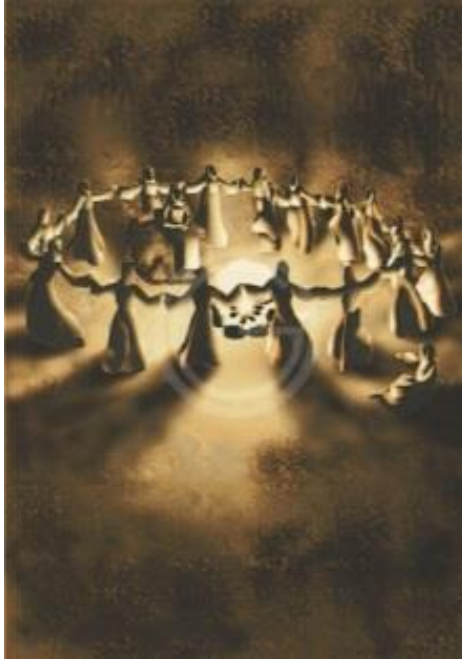
Fig. 2. Damas del Fuego haciendo un círculo.

De pronto, la mujer líder chamán entró en el círculo, desnuda y con su cuerpo pintado. En su cabeza tenía un pañuelo lleno de plumas, que simboliza la Tribu Aves acuáticas que estaban trabajando para rescatar. Ella comenzó a bailar, y otras hembras comenzaron a golpear tambores. La chamana bailaba más y más rápido, y otras chamanas entraron en el círculo, también desnudas con tocados de plumas. A medida que el ritmo de los tambores se quedó en un ritmo constante, rápido y complicado, las chamanas bailaron hasta llegar a un trance, cambiaron de forma en diferentes entidades, como osos, aves y seres como peces, y luego de vuelta a su forma humana de nuevo.