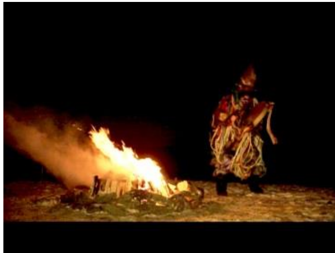
Fig. 1. En.ki preparando el ritual chamánico.

Muchas veces, él tuvo éxito, pero lejos de todo el tiempo. Él utilizó una historia inventada como una línea de base para su técnica hipnótica, diciéndole al Namlú'u que Gaia estaba a punto de ser invadida, y si sólo pudieran liberar a los mejores soldados del Señor En.ki, que eran prisioneros de guerra en un lugar horrible en otro sistema estelar, los invasores no tendría ninguna oportunidad -- de hecho, el Señor En.ki ni siquiera los dejaría entrar en el sistema solar. Esto, por supuesto, no era cierto, pero En.ki justificó explicando que siempre había una posibilidad de que los de Orión invadieran , así que lo que él les estaba diciendo los Lulús tenía cierta verdad en ella, pensó. También halagó a las mujeres y les dijo que tenían poderes que nadie más tenía, que estaban simplemente latentes. Sin embargo, él, En.ki el Gran Chamán, podría enseñarles cómo acceder su poder, y que tenía que ver con los rituales, sobre todo un ritual de sexo chamánico, que hoy se llama el sexo tántrico .