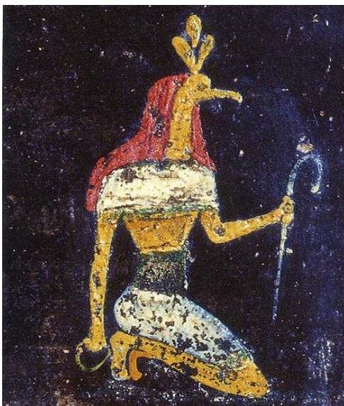
Fig. 1. Thoth, depicted as an ibis bird. Again, here we have the Bird Tribe .

According to ancient Egyptian tablets, Thoth is the deity who is leading the dead down through the layers of the Underworld—all this is also acting as an inspiration to Dante’s Inferno [3] , with its seven layers of Hell. Allegedly, there are seven layers or “Gates,” until a person has reached all the way down to where Queen Ereškigal’s throne is. In many myths, it is the well-known AIF member, Thoth who puts judgment on the soul and decides her destiny.