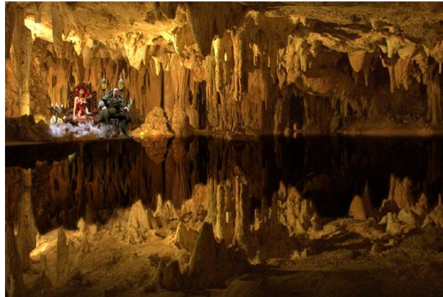
Fig. 2. Throne of Nergal and Ereškigal.

According to this Egyptian version, there is a reason why Nergal/Lucifer is storming the Underworld, which is that Ereškigal apparently is in possession of something very powerful that Nergal wants. According to the text, Ereškigal says after the six-day long lovemaking session: