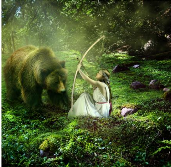
Fig. 6. "Artemisa se enfureció y apareció en la forma de un oso, culpando la violación en Calisto, y quería matarla."

En la mitología, una de las ninfas que se llamaba Calisto [25] , y en los ojos de EN.KI, ella era la más atractiva y adorable de todas las ninfas que encontró en el Jardín del Edén. Así que, como lo había hecho tantas veces antes, En.ki utilizó lo que tenía entre las piernas -- su serpiente --y violó a Calisto! [26]