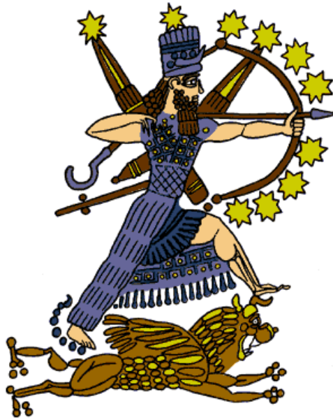
Fig. 3. Ninurta, también con una flecha y un arco.

Esto demuestra que "EN.LIL," como lo conocemos por medio de Sitchin, y la mayoría de otras fuentes, no vino de Sirio, sino del Imperio de Orión. Este es un ejemplo de libro de texto de lo importante que es buscar en la mitología para comprender nuestra historia, y en este caso, para entender a partir de donde se originan los diferentes dioses.