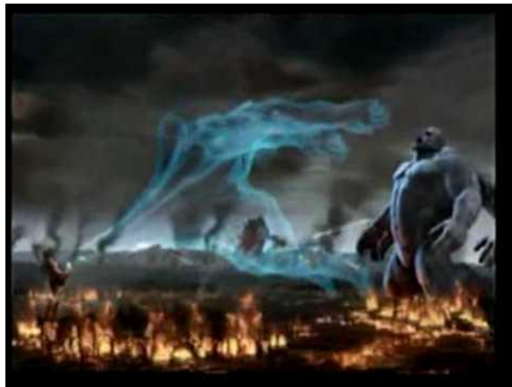
Fig. 7. Algunos de los gigantes eran de estatura extrema, y podrían ser de hasta 300 pies de altura.

En estos días, Gaia era un extraño planeta para visitar porque había una gran cantidad de diferentes experimentos andando por el planeta al mismo tiempo, y muchas de estas especies no se llevaba muy bien entre ellos. Por lo tanto, hubo muchas guerras entre dioses, hombres y monstruos.