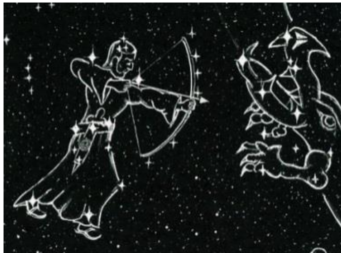
Fig. 2. Orión con arco y flecha.

En la mitología, Artemisa y Orión eran compañeros de caza, y eran buenos amigos, algunos dicen que incluso se amaban. [3] Tanto Artemisa como Orión eran a menudo representados con la flecha y el arco, como un símbolo de ser "cazadores". El mito dice en relación a Artemisa: "Sus símbolos incluyen el arco de oro y flecha, el perro de caza, el ciervo, y la luna" [4] Luego, si investigamos a Orión, nos encontramos con que él es un gran cazador también, y él a menudo es visto llevando una espada o un arco y una flecha, siendo un arquero (ver fig. 2).