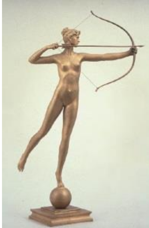
Fig. 1. Artemisa, con el arco y la flecha.

En la mitología, Artemisa y Orión eran compañeros de caza, y eran buenos amigos, algunos dicen que incluso se amaban. [3] Tanto Artemisa como Orión eran a menudo representados con la flecha y el arco, como un símbolo de ser "cazadores". El mito dice en relación a Artemisa: "Sus símbolos incluyen el arco de oro y flecha, el perro de caza, el ciervo, y la luna" [4] Luego, si investigamos a Orión, nos encontramos con que él es un gran cazador también, y él a menudo es visto llevando una espada o un arco y una flecha, siendo un arquero (ver fig. 2).