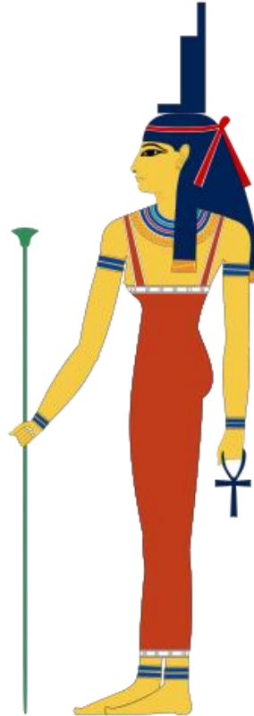
Fig. 5. "Isis se ve a menudo llevando un trono en la cabeza, lo que indica su conexión real a Sirio."

Isis se ve a menudo llevando un trono en la cabeza, lo que indica su conexión real a Sirio. Desconocido para muchos, sin embargo, también representa a la Osa Mayor y la Osa Menor, la Osa Mayor y la Osa Menor , a través de su padre, el príncipe Ninurta, y sus abuelos, la Reina de Orión y Khan EN.LIL. Al parecer, fue después de sus encuentros con En.ki que ella fue "recompensada" con el Trono de Sirio, que él mismo había afirmado ese dominio después de algunos "acuerdos" con los lugareños. Sin embargo, línea de sangre de Isis sigue siendo la de Orión, a través de su padre, Ninurta. Sigue siendo cierto que los seres humanos tenemos sangre de Sirio corriendo en nuestras venas, pero eso es aún más cierto cuando se trata de lo que hablaré más tarde acerca de los linajes de la Élite Global.