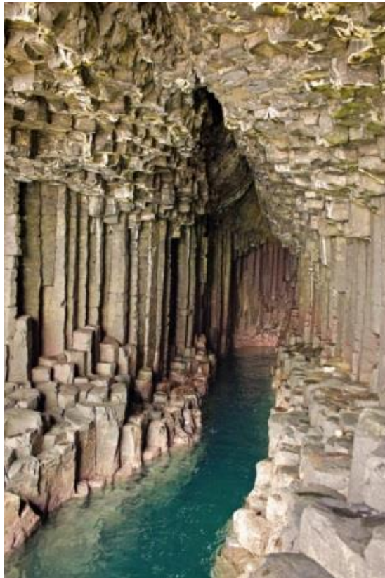
Fig. 4. La entrada mágica al Paraíso de Montaña de Ninurta -- el Jardín del Edén.

Las mujeres se detuvieron repentinamente y miraron hacia la luna. La señalaron y dijeron algo que En.ki no podía oír. También él miró, notando que era luna llena. De hecho, parecía mucho más grande de nuevo en estos días, ya que estaba más cerca de la Tierra. Esto permitía a los seres, animales y plantas a ser más grandes en tamaño, y más altos de lo que son hoy. No fue sino hasta después del Diluvio, 11.500 AC, que En.ki movió la luna a una mayor distancia para que se hiciera más distante. La luna tiene mucho que ver con nuestro bloqueo en esta banda de frecuencias en la que la Fuerza Invasora Alienígena nos puede controlar.