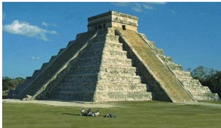
Fig. 8. Una pirámide maya. Mucha sangre de vírgenes sacrificadas, niños, adultos y animales corrió por dichas formaciones de piedra en el antiguo pasado.

El lector debe comprender que las guerras y los disturbios en el Medio Oriente no tienen nada que ver con quién debe ser asignado a qué país/región. Este es el territorio de los dioses, y algunos dicen que hay una base de la Fuerza Invasora Alienígena subterránea en algún lugar de Oriente Medio, y lo más probable es que haya más de una. Lo que vemos en el Medio Oriente es la lucha por el "territorio de dios" y más que nada lo que está bajo tierra. El resto es la desinformación dada a las masas, para que la Elite Global pueda justificar una guerra. Si los hombres y las mujeres jóvenes, que se inscriben al servicio militar con el fin de luchar por su país supieran que esto es una gran mentira. Ellos están luchando y muriendo, para que la Elite Global y los dioses puedan restablecer su nuevo reino en la Tierra ! Mira cómo están tratando a los veteranos han sacrificado su salud y sus vidas para proteger al resto de nosotros, o eso creen. ¡Es una vergüenza! ¿El lector de acuerdo conmigo sobre la importancia de que todos nosotros despertemos? Mucho dolor y sufrimiento podrían ser evitados.