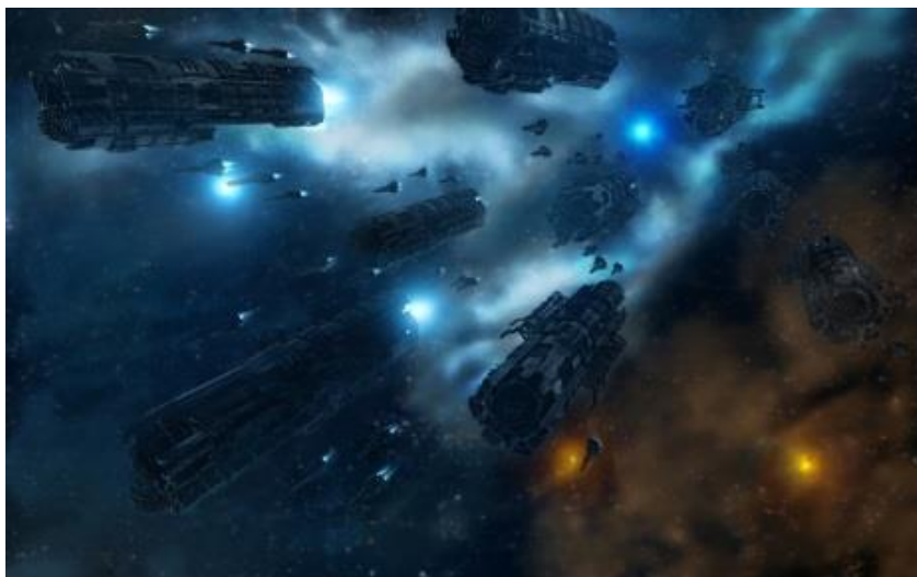
Fig. 2. batalla espacial Siria entre la armada de Khan EN.LIL, los MIKH-MAKH y los DAKH de Lucifer.

Khan EN.LIL y la reina de Orión habían encarcelado injustamente a la gente de Lucifer porque el trono de Orión era de Lucifer, y la Reina y el Khan estaban aterrorizados de que él tomara el trono de ellos. Por lo tanto, habían tomado precauciones y encarcelado gente de Lucifer y les habían despojado de sus hogares. Eventualmente, la gente de Lucifer se había convertido en nómadas espaciales pero todavía viajaba por todo el Universo para ayudar a razas tales como ellos a evolucionar por sí mismas. Ahora, los de Orión habían regresado con la intención de matar a Lucifer y a su pueblo una vez por todas, por lo que los Sirios estaban listos para devolver parte de lo que habían recibido durante milenios. Esto era, consideraron, lo menos que podían hacer!