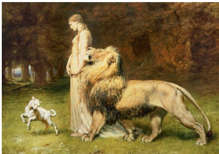
Fig. 8. En la Edad de Oro, no existían depredadores.

El paraíso de Tiamat no sólo incluía una pequeña zona de montaña, sino que también se extendía por todo el planeta. La vida era simple, pero no demasiado simple: había también desafíos, que debían ser para hacer cosas interesantes, pero las guerras eran desconocidas por el Namlú'u, que sólo había conocido la paz desde que se crearon sus almas. Al igual que los vulcanos y los Khan, que estaban presentes en el planeta, junto con su comandante, el príncipe Ninurta, el Namlú'u eran los Hijos de la Diosa Madre .