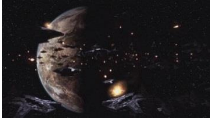
Fig 1.. la armada espacial de Khan EN.LIL fuera del planeta Sirio A.

Después de un silencio que pareció durar para siempre, Khan EN.LIL hizo oír su voz. Le dijo a su hijo que se entregase, con el fin de ser puesto a disposición judicial por infringir la Ley de interferencia. También le dijo a la raza en evolución que no interfiriera con la detención de Lucifer.