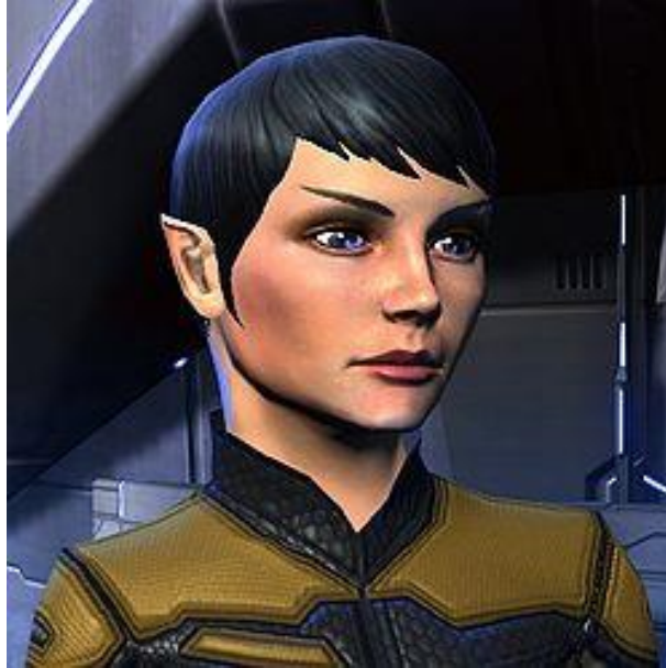
Figura 7. Un Vulcan, como se muestra en Star Trek (supuestamente viéndose muy cercano de las especies reales). Esta raza homínida se origina en el sistema estelar Vega en la constelación de Lira.

como los duendes y gnomos, probablemente provienen de los Vulcanos también. Los vulcanos tenían el fuego de la Diosa.