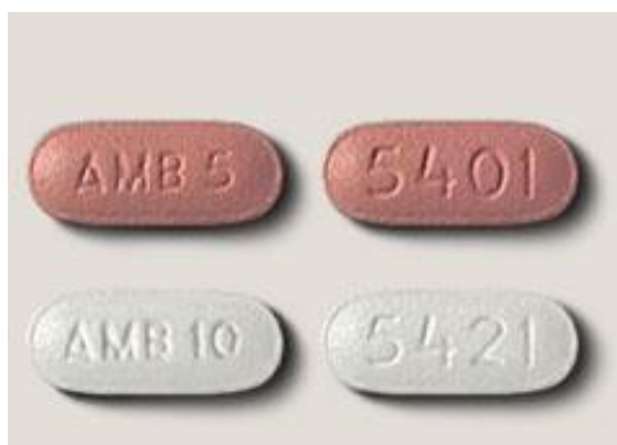
Fig. 9. Ambien

Un médico se interesó mucho en este caso, y aunque él no creía, al principio, que era el Ambien la que lo hizo, él rápidamente cambió de opinión. Trató el mismo tratamiento en un antiguo "comunicador de publicidad", que es una persona que habla en un anuncio con voz muy positiva, rápida y optimista, con el propósito de hacer que la gente compre el producto. Él tuvo un derrame cerebral y sólo podía balbucear con la lengua fuera de la boca. Una hora después de tomado el Ambien , estaba de regreso en el micrófono y habló como lo hacía cuando estaba en su apogeo! [28] [29] [30] Fig. 9. Ambien