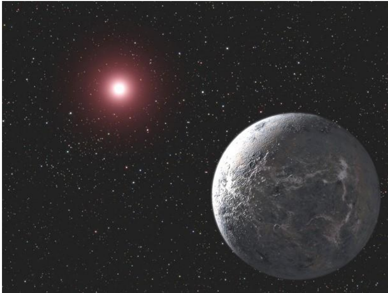
Fig. 3. Nibiru, en órbita alrededor de Sirio C antes de la catástrofe. Sirio C era entonces un sol rojo.

Debido a que los Nibiruanos se habían preparado, se las arreglaron para salvar a casi un tercio de la población de aproximadamente mil millones de personas. El resto sucumbió a la guerra y murió en la superficie del fuego cruzado de las bombas o de cuando el planeta fue catapultado fuera de órbita.