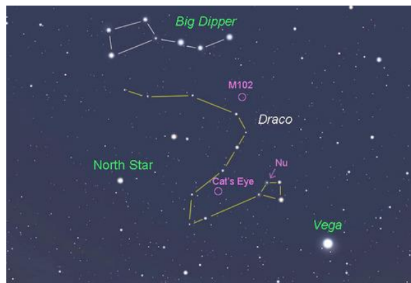
Figura 5. Draco, en relación con Vega, Osa Mayor, y la Estrella del Norte-Polaris. Sin embargo, 3000BC, en tiempos sumerios, Thuban (alfa Draconis) era la estrella del norte. [2]

A muchas de las razas estelares leales de Lucifer de Canis Major se les dio la orden, por su alto Comandante, de dejar Sirio y asegurarse de poder usar Alpha Draconis como una fortaleza, con el propósito de conquistar la Galaxia desde allí. El hijo de Lucifer, Marduk, fue puesto a cargo sobre ese proyecto. Sin embargo, otra guerra estalló en el sistema estelar Thubanese (Alpha draconiano), que ya estaba poblado por una raza bastante avanzada, que dio a los DAKH cierta resistencia. Sin embargo, cuando los DAKH se ponían furiosos, no era para jugar, y ellos empezaron a usar sus armas más devastadoras hacia los Thubanesios y violaban y torturaban cuando tenían la oportunidad. No pasó mucho tiempo hasta que la población de Thuban tuvo que dimitir. Se convirtieron en esclavos y se unieron a las tropas de Marduk bajo la bandera de Lucifer. Thuban era un bastión estratégico para Lucifer porque no podía atacar ni a Arcturus ni a los asterismos cerca, por lo tanto, poco a poco iban acercándose a Orión. Thuban ha sido desde entonces el bastión de Marduk, y con el fin de crear soldados fuertes de los Thubaneses, ellos violaron a sus mujeres y crearon su propia raza híbrida, que desde entonces ha sido su propio ejército.