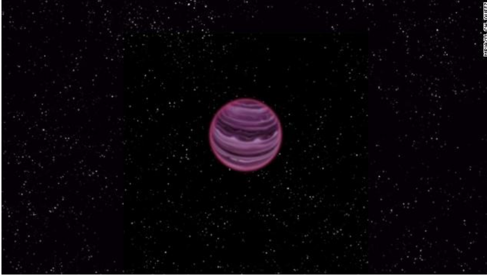
Fig. 6. Un “planeta a la deriva”, sin un sol para para calentarlo. Incluso la NASA ha admitido que estos planetas son probablemente comunes en el cosmos. ¿Podrían algunos de estos planetas albergar vida?

Lucifer dejó una tripulación en Nibiru y enseñó a la población sobreviviente cómo ser excelentes sobrevivientes del espacio profundo y cómo utilizar portales estelares y puentes Einstein-Rosen puentes- por lo tanto, utilizando el Khaa a fin de avanzar más rápidamente de un punto a otro. También se convirtieron en excelentes mineros, ya que su planeta contenía una cantidad significativa de oro que podían extraer para salvar su atmósfera. Lucifer también enseñó a los seres más inteligentes del planeta cómo comer del árbol de la vida para prolongar su vida útil, al igual que hicieron los dioses. Luego se les enseñó a cómo llegar a ser aún mejores guerreros. Lucifer tenía planes para utilizarlos en el futuro.