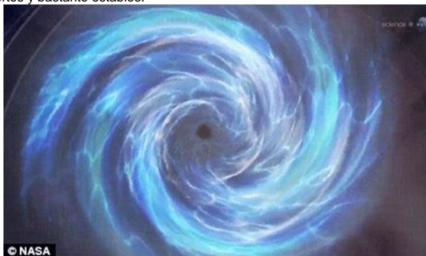
Fig. 2 Un portal entre la Tierra y el Sol

La mayoría de estos portales son muy pequeños y se abren y cierran en cuestión de segundos, mientras que otros son muy abiertos y bastante estables.