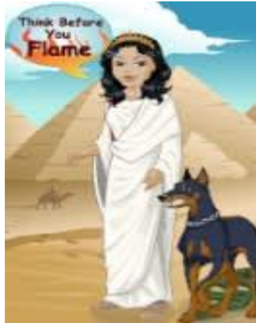
Figura 1. Abraxas, como ella describe a sí misma en el original foro del Proyecto Avalon.

El Consejo Thuban, que está dirigiendo su mensaje a la humanidad, no son seres 3D, sino de la 12 a dimensión, que está dentro del Khaa (también llamado el 96%, o el VACÍO). Abraxas en realidad nos está diciendo que ella es del VACÍO, y que el 12 de dimensión no está en el universo físico.