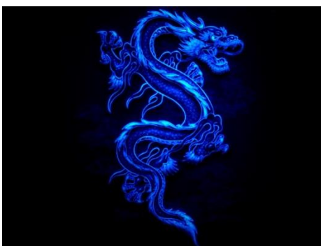
Figura 2. "El Maestro Dragón Azul", aquí moviéndose a través del VACÍO en una forma de onda sinusoidal.

Los Thubans distinguen entre los dragones Azul Cielo o de color Cian y el Dragón Rojo. El primero es el Maestro Dragón y el último es llamado el "Diablo" en la profecía, y es así neutralizado (dado de alta) en la Serpiente Entrelazada o Doble-Dragón del Lucifer Blanco con el Lucifer Negro. Pero mientras estamos leyendo este artículo, es necesario tener en cuenta quién es este grupo de entidades, que se declaran a sí mismos estando bajo el Primer Creador. Dicen que son tanto nuestros antepasados como nuestros descendientes, como tantos otros. La cosa es que si nos fijamos en esto en perspectiva, hay una posibilidad de que cada una de estas fuentes canalizadas que dicen que son nosotros en el pasado y en el futuro podrían decirnos la verdad. Tenemos a los Grises, tenemos a los Pleyadianos, a los Casiopeos, y a muchos más... Todos ellos encajan en esta agenda, como veremos más adelante.