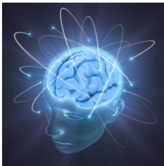
Figura 1. Neuro-vías.

Estaremos atrapados en nuestras líneas de tiempo, y los eventos de vidas pasadas nos mantendrán encarcelados en esta realidad, porque nunca podemos romper la cadena de acontecimientos en nuestras propias mentes. Esto es por lo que he estado hablando de que nuestras líneas de tiempo se fusionarán antes de poder desprenderse y convertirse en multi-d. Los acontecimientos y las mentiras que nos han mantenido estancados en el pasado deben ser confrontados, reflexionados, y realizados.