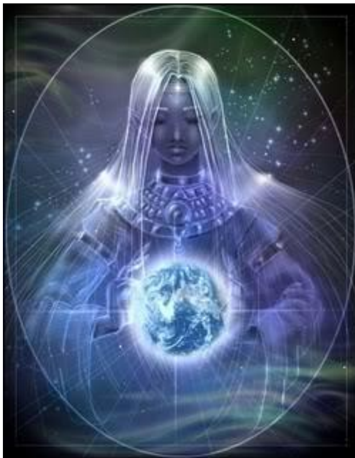
Figura 3. A los llamados "niños índigo", que tienen talentos especiales y habilidades psíquicas.

adicional sobre ellos. ¡Recuerde que estos niños son nuestro futuro! No empecemos nuestra nueva era traumatizando a nuestros niños talentosos etiquetándolos de "especiales".