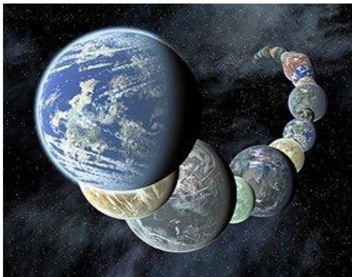
Figura 6. El número de Tierras es casi infinito. Aunque algunos de nosotros vamos a percibirnos a nosotros mismos como viviendo en el mismo planeta, en realidad estamos todos viviendo en nuestra propia versión del mismo.

Sin embargo, no hemos visto ninguna evidencia de que una guerra contra Orión vaya a ocurrir en el futuro, pero sabemos que en ciertas líneas de tiempo, la humanidad se convertirá en ciborgs y perderá todas las habilidades que tenían sus cuerpos divinos, y se arrepentirán profundamente. Ellos harán todo lo posible para convertirse en humanos de nuevo, pero de todo lo que he visto, no van a tener éxito. Sea feliz de que usted es uno de los que optan por evolucionar sin tecnología!