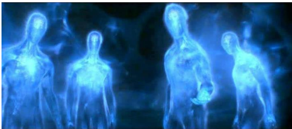
Figura 5. Los Sirios ya no serán capaces de seducirnos y manipularnos para entrar en su prisión astral tiempo/espacio.

Estamos en ese momento mucho más cerca de operar fuera de la frecuencia 3D de Sirio, y mi estimación, basada en lo anterior, es que ya después de un par, o unas cuantas generaciones, el control de Sirio no será perceptible desde la vibración dentro de la cual operará la Nueva Tierra.