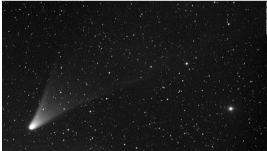
Figura 4. Cometa PanSTARRS, pasando tan cerca de la Tierra a principios de marzo de 2013, que la podíamos ver después crepúsculo con nuestros propios ojos.

[ http://www.cnn.com/2013/03/02/us/comets-2013/index.html?iref=TodoBuscar ]