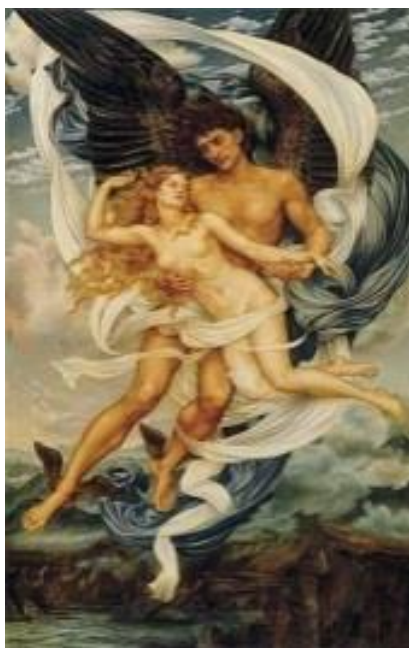
Figura 3. Los Néfilim.