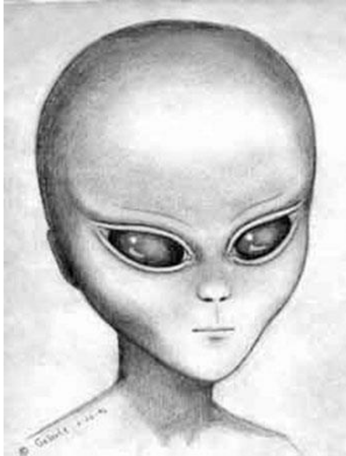
Figura 4 Impresión del artista de un Essassani Gris

El resultado final de todos estos secuestros desde el futuro es la raza Essassani (Bashar).