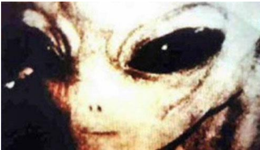
Figura 5 Un primer plano de un "Zeta" Gris, Como estamos acostumbrados a verlos.

Supuestamente, ellos se han instalado en un sistema estelar más allá de lo que vemos en el cielo como la constelación de Orión . [5]