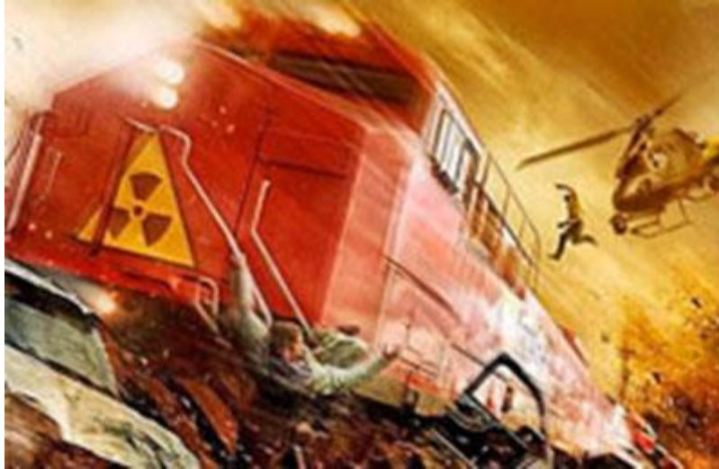
Figura 2-5. Tren fuera de control

Ahora, dieciocho años más tarde, estoy escuchando una conferencia por el mismo grupo de Pleyadianos, y estamos hablando de un 'evento unificador' que puede ocurrir este año, dependiendo de en qué dirección van las energías.