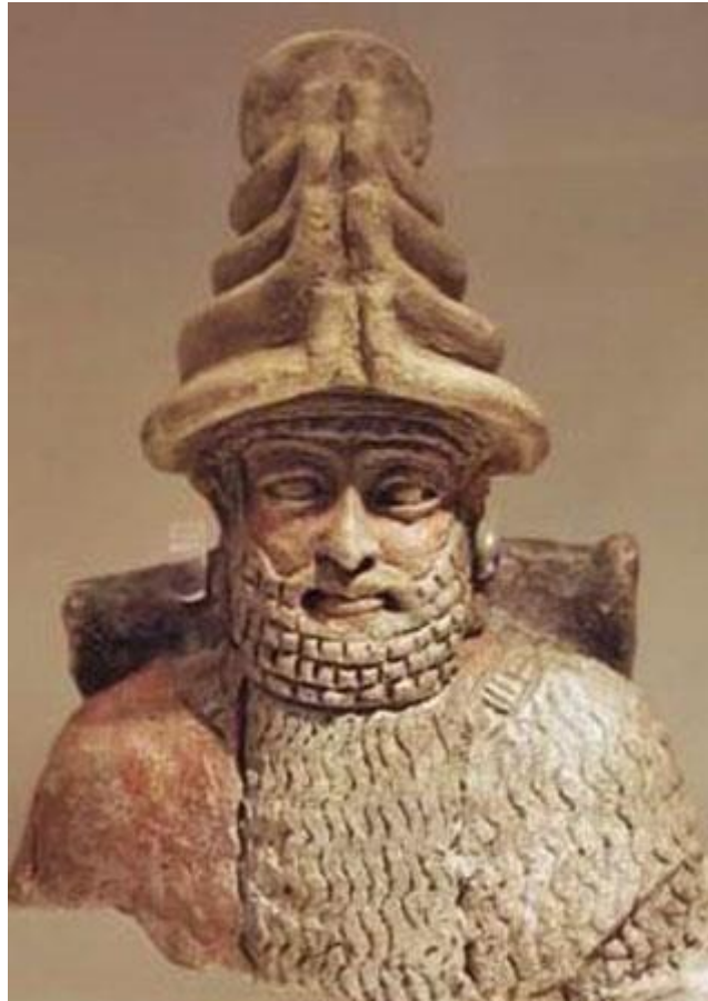
Figura 2-3 Príncipe Utu Shamash, 'dios' con cuernos de Sirio, en el cuerpo que habitaba en la antigua Mesopotamia. Hoy, él está supuestamente en su sexto cuerpo.

Pero primero, permítanme empezar con decirle al lector cómo comenzó mi relación con Utu.