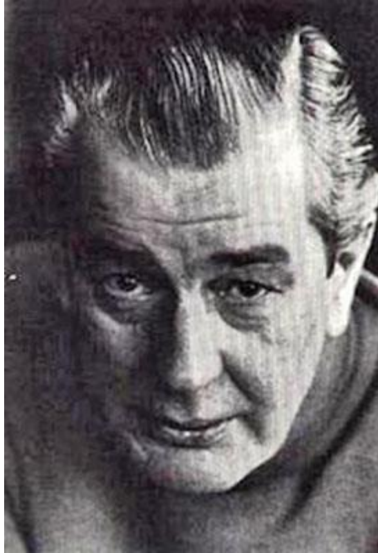
Figura 2-1 Brinsley Le Poer Trench, 'Flying Saucer Review Magazine'.

Según Trench, el editor/autor y publicador de la edición noviembre-diciembre de 1958, el artículo original se encuentra en la edición de noviembre de 1947 'Cuentos Fantásticos' (USA), escrito por un seudónimo, Alexander Blade. [2]