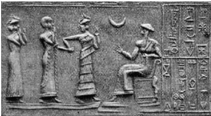
Figura 2-3 Nannar (el padre de Utu) está presente aquí en este viejo relieve de 2100 AC en forma de media luna, que es su símbolo.

Yo todavía estaba escéptico, sin embargo.