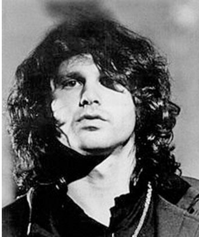
Figura 2-4,1 Jim Morrison, 1969

El fallecido cantante estadounidense tarde, poeta y compositor, Jim Morrison de The Doors , fue entrevistado por Lizzie James en algún momento a finales de 1960.