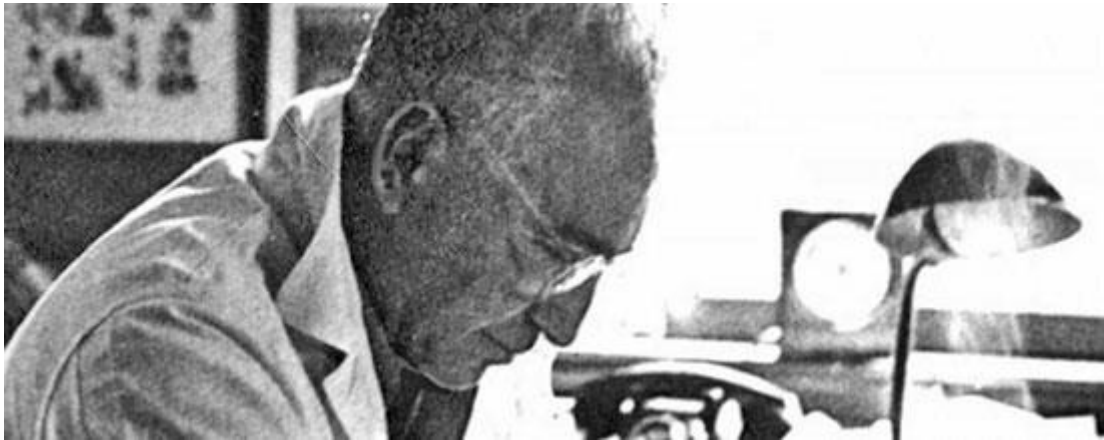
Figura 2-4 Wilhelm Reich

Pronto las batallas no serán luchadas ya en el mundo físico, sino en el mundo microscópico, a nivel celular!