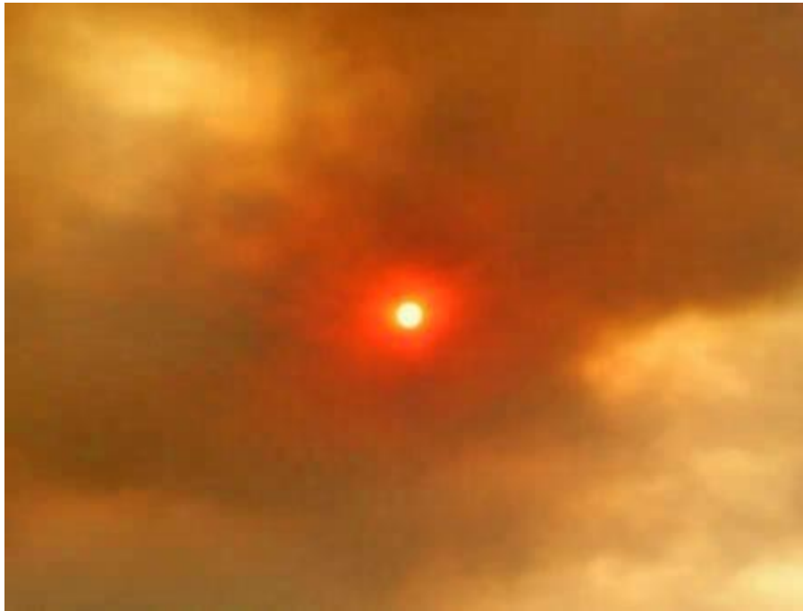
Figura 2-2 Nibiru, cuando está llegando muy cerca, supuestamente va a aparecer como un "segundo sol" en el cielo. Según algunos reportes, eso ya ha sucedido.

Si lo hacen, esté alerta, porque son casi ciertamente engañosos.