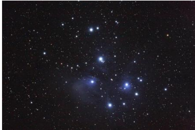
Figura 3-7 El cúmulo de estrellas las siete hermanas en las Pléyades (La constelación de Tauro)

El cúmulo estelar de las Pléyades está en la constelación de Tauro (el toro).