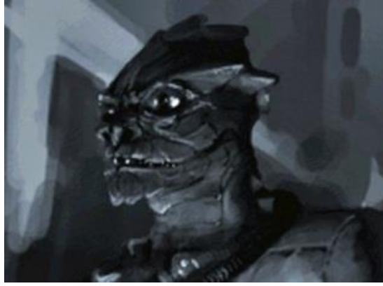
Figura 3-2 Macho Ario reptil, temprano en su desarrollo, como nosotros en comparación con los hombres-mono. Más tarde evolucionaron a verse más similar al humano (Representado aquí como imaginado por este autor)

Este nuevo universo era un universo de "libre albedrío", un experimento en sí mismo para ver cómo las entidades vivientes podrían sobrevivir en un ambiente más áspero y todavía desarrollar el amor, la compasión y la empatía y aprender el "Formas de la Diosa".