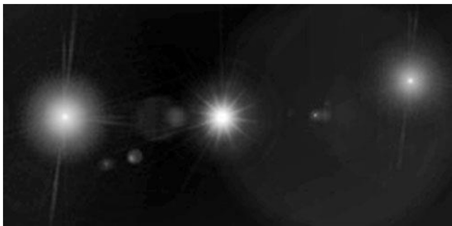
Figura 3-1 El Cinturón de Orión

Un equipo de Constructores [def] fueron nombrados, y el espectáculo comenzó en este Universo joven, hace miles de millones y miles de billones de años.