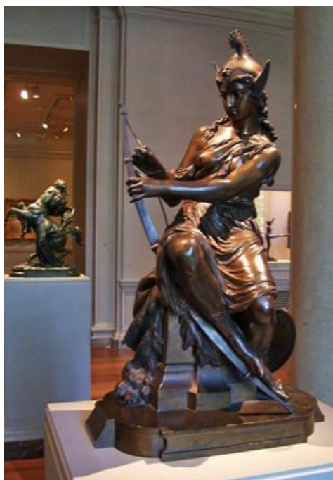
Figura 3-3 La visión de un artista de una guerrera Amazona

Y así empezaron otra guerra galáctica en un esfuerzo por expandir el Imperio.