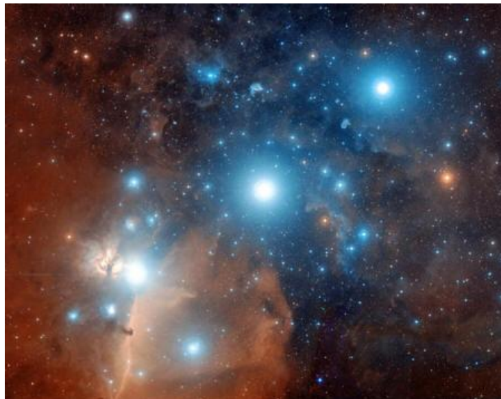
Figura 3-5 Cinturón de Orión: Alnitak, Anilam, y Mintaka, la sede del Imperio de Orión

No quería que el Noveno Pasaje cayera en las manos de los Señores de Sirio.