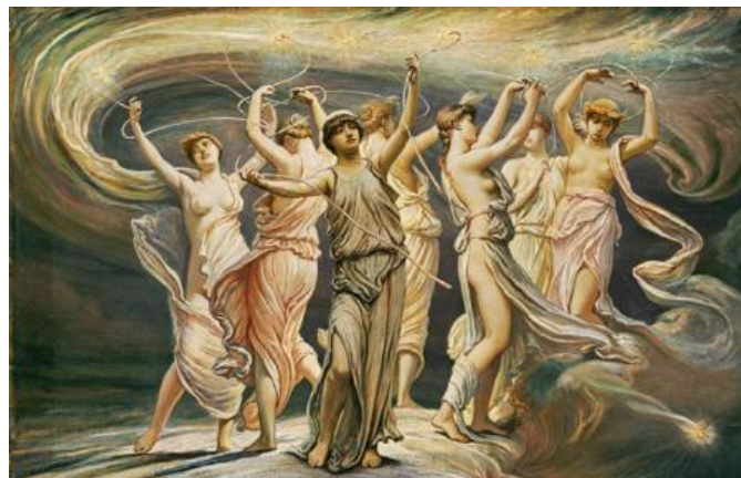
Figura 3-6 Las siete hermanas haciendo una danza ritual, según un artista.

Esto correspondería bastante bien con el chamanismo ario, como es descrito en los documentos anteriores.