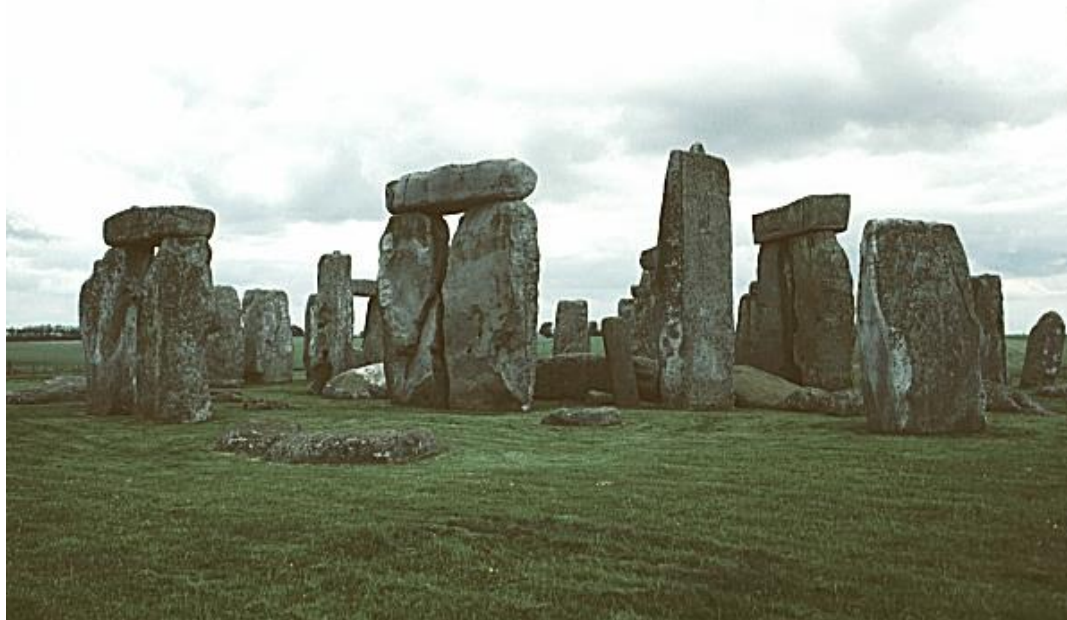
Figura 1-6. Stonehenge, un vórtice de sexualidad sagrada y fertilidad.

mucha investigación, tanto mía propia como de otros investigadores. Nadie, hasta donde yo sé, comprende este tema por completo. Espero que algún día yo sea capaz de conseguir ideas, o que alguien me explique a mí todo este fenómeno desde una perspectiva más elevada. Pero hasta entonces, por lo menos tenemos información que es valiosa y fundamental para comprender su importancia relativa.