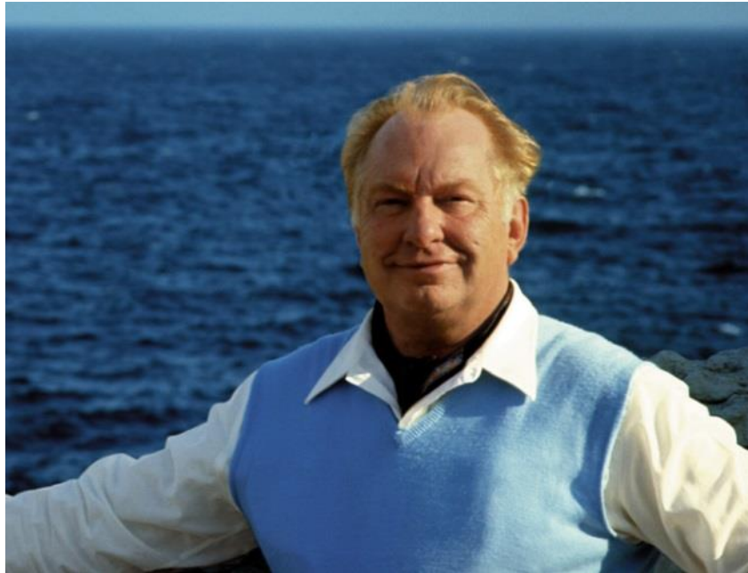
Figura 1-2. L. Ron Hubbard, fundador de la Iglesia de la Cienciología, un gran tiempo de Organización de Sirio.

Como podemos ver, todo esto es muy complicado, donde seres como Aleister Crowley y L. Ron Hubbard (autoproclamado sucesor de Crowley) juegan un papel muy importante en la pavimentación de la carretera por lo que está por venir.