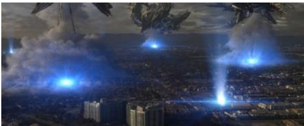
Figura 1-1. La "Cosecha". El Pueblo elegido teletransportado en naves espaciales.

Este proceso de despertar es de su propio mérito, y usted puede hacerlo todo por sí mismo, y está destinado a hacerlo. Hay seres estelares que, mediante la canalización de su información, le están diciendo la verdad acerca de la Cosecha, pero añaden la siguiente cosita "insignificante", como un giro a la misma, le dicen que ellos son los que le ayudarán en el proceso y guiar a los iluminados para que terminen en el lugar correcto.