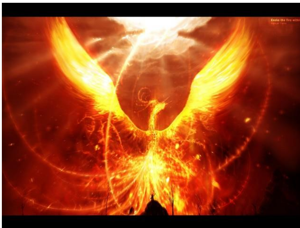
Figura 1-3. El Fénix, que renace de las cenizas de un Viejo Ciclo a uno nuevo (Hay un montón de cosas sucediendo en esta foto!).