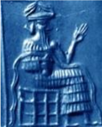
Figura 8-1. EA

ENLIL entendía, pero sin decirlo a su hermano, él tenía miedo de los seres humanos.