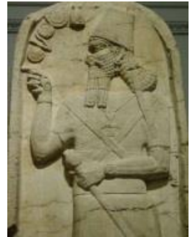
Figura 8-2. ENLIL

Que la humanidad promedio olvide quiénes son y de dónde vienen Si todavía tienen el Fuego, podemos tomar ventaja de ellos, también, pero sí criamos ciertos Linajes, podemos dejar que hermanos y hermanas, padres e hijas, madres e hijos sean íntimos y tengan hijos. Estos niños serán nuestros para usar. El resto de la humanidad serán nuestros esclavos, sirvientes y soldados de a pie como de costumbre. Por último, mejorar la inteligencia de los que solían ser mis mineros y esclavos antes del paso de Ša.AM.e a aproximadamente el mismo nivel que el Erectus. Su configuración genética, sin embargo, impedirá que los espíritus de fuego entren en estos cuerpos. Estos humanos no tendrán el Fuego de la Khaa! "