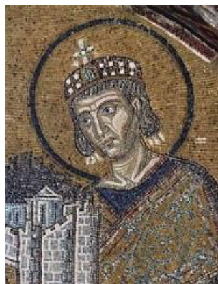
Figura 8-2. El emperador romano Constantino el Grande, en una representación de la ciudad de Constantinopla, que fundó e hizo la nueva capital del Imperio Romano.

En el Concilio de Nicea en el año 325 DC, Constantino decidió poner la Biblia junta. Él inspiró a la gente a venir a él con todas las escrituras sagradas que tenían y dejarlas con él. Constantino encontró su morada abrumadoramente llena de textos antiguos, escritura cuneiforme y otras clases de escrituras. Y había mucho acerca de Jesús de Nazaret y María Magdalena, y la verdadera historia de los dos.