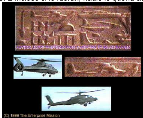
Figura 7-12. Aquí están los jeroglíficos antiguos que muestran claramente que los antiguos ya habían inventado buena parte de la maquinaria y las tecnologías que tenemos hoy. Este jeroglífico muestra un helicóptero, un avión Sirio y algún tipo de vehículo utilizado en el suelo.

Y, por supuesto, las guerras estallaron, y conflictos fueron creados. Algunos de los "habitantes profundos" afirmaban que aquellos que vivían en la superficie de la tierra eran intrusos y su propia especie era la heredera legítima del planeta, algo que divirtió a algunos de los seres humanos, mientras que otros se sintieron insultados. Nadie, sin embargo, se tomó el tiempo para averiguar si los habitantes de las profundidades eran correctos o no. E incluso si lo fueran, nadie lo quería admitir, de todos modos.