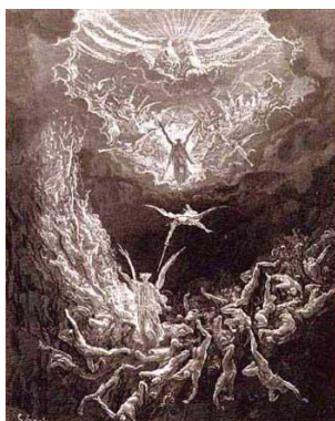
Figura 7-8. Arcángel Miguel y sus guerreros Makh echando fuera a los rebeldes del "Cielo"/Orión (pintura de Gustave Dore).

El libro de Urantia distingue entre Satanás, Lucifer, y el Diablo. Son claramente tres personalidades diferentes [10]. Traducido a la historia oculta, el Diablo (Caligastia) se corresponde mejor con Marduk, el hijo de EA, aunque el libro de Urantia no nos lo dice claramente. Marduk, al igual que Caligastia, más tarde fue asesinado aquí en la Tierra, y Alejandro Magno, de quien se dice que fue el hijo híbrido de Marduk, vio a su padre muerto en un ataúd. Sin embargo, debido a que estos seres estelares saltan cuerpos, Marduk no se quedó "muerto" por mucho tiempo.