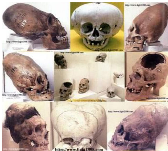
Figura 7-9. El lector ya estará probablemente familiarizado con estas fotos ahora. Pero merecen ser mostradas de nuevo, debido a que estos cráneos (o algunos de ellos) pueden muy bien ser cráneos de los gigantes Néfilim. Sin embargo, el Señor de EA y su equipo experimentaron ampliamente con la genética en el área de la Atlántida, y todos estos diferentes cráneos en realidad podrían ser restos de diferentes proyectos en curso al mismo tiempo; algunos de ellos él los abandonó con bastante rapidez.

Señor Enlil nunca estuvo contento con esta nueva creación. Habló con EA y expresó su preocupación de que habían demasiados jefes y que esto derrotaba el propósito con todo el experimento. Además, los Néfilim tenían una tendencia a meter la nariz en todo y eran "degradados" en comparación con los seres humanos. EA dijo a su hermano que esperara el momento oportuno; esto era sólo el comienzo de un experimento de prueba, y si no funcionaba, EA podría suspenderlo. Este no fue el único experimento EA tenía en curso, le dijo al Jefe Supremo de Sirio. ENLIL se fue después darle a EA una larga mirada.