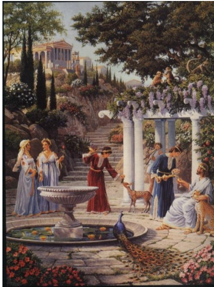
Figura 7-7. El Rey Atlante siendo entretenido por su harén de Mujeres de Fuego.

Al igual que en Mu, las sacerdotisas chamánicas podían comunicarse con los animales y pasaban mucho tiempo, especialmente con los delfines y las ballenas. Estos animales muy inteligentes estaban más que dispuestos a ayudar a los seres humanos con lo que necesitaban, y ellos a menudo eran utilizados tanto como mensajeros de material físico entre la tierra y los que vivían bajo la superficie del océano, pero también para mensajes telepáticos especiales. Los chamanes y mucha gente de Fuego habían desarrollado habilidades telepáticas de visión remota, y la utilizaban para ayudar a las personas. Los predecesores de las modernas cartas del tarot fueron utilizados para hacer ver las cosas más sofisticadas; lo mismo con la bola de cristal. Nada de esto se necesitaba, pero aquellos que no tienen acceso al poder del 96% apreciaban cuando podrían relacionarse con algo físico (como una bola de cristal o una baraja de cartas) cuando el Sacerdocio Atlante utilizaba sus habilidades psíquicas. Se hacía más real para ellos.