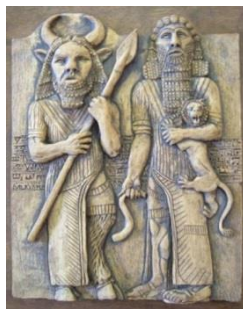
Figura 7-11. ¿Así es como se veían aproximadamente en la carne? (Aquí tenemos a Enkidu, el androide, a la izquierda y Gilgamesh a la derecha; él, que quería la inmortalidad de los dioses.