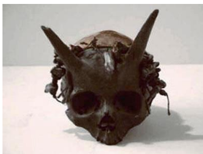
Figura 7-10. Un cráneo con cuernos. Uno de los experimentos genéticos abandonados de EA, usando principalmente ADN de Sirio?

La Tierra debe haber sido un lugar muy extraño, de hecho, en esos días, con todos estos prototipos caminando en la superficie y bajo tierra. Parece que EA y NIN se inspiraron en gran medida a experimentar después de la llegada de los Pleyadianos, y seres humanos fueron cruzados con animales de nuevo, pero esta vez de una manera aún más sofisticada. Uno podía ver cuerpos humanos con cabezas de toro (un rasgo de las Pléyades), cabezas de aves (más de las Pléyades), y otras grotescas anomalías.