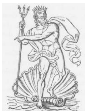
Figura 7-2. EA/ENKI como Poseidón

Así que parece que Poseidón eligió construir su palacio en una montaña (al parecer, no ajeno a los Sirios, cuya cultura EA había adoptado mucho) y la ciudad fue creada alrededor de ella con canales extendiéndose hasta el mar, lo cual era cierto elemento de Poseidón. Hoy escuchamos mucho acerca de OVNIs visto ascender del agua, ya sea desde grandes lagos o del mar. Esto tiene mucho sentido, porque hay muchas bases extraterrestres bajo el fondo del océano, protegidas y seguras de los curiosos.