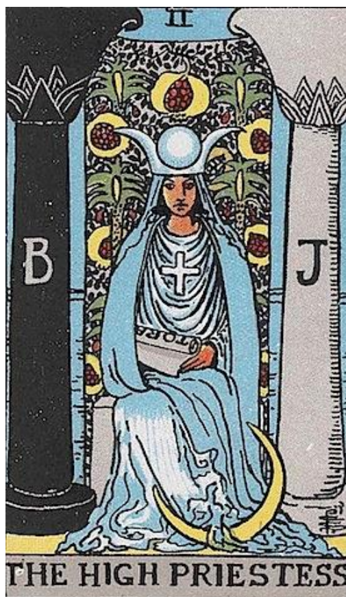
Figura 7-6. La 'Gran Sacerdotisa' en la carta del tarot la muestra vestida con una túnica de lino blanco.

hormigas obreras para los jefes supremos de Sirio. Ellos todavía están trabajando en estrecha colaboración con ellos hasta el día de hoy, y cuando vemos Grises, los sirios no están muy lejos. El uniforme espacial que los trabajadores humanos usaban eran de color azul oscuro y tenía el disco solar alado tatuado en la manga.