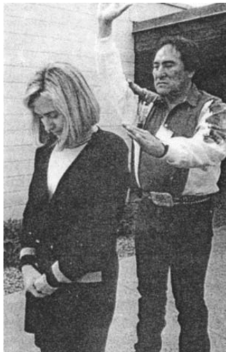
Figura 7-4. ¿Hillary Clinton siendo curada por un chamán indio nativo?

La mayoría de la gente piensa que la Élite Global fue creada por los Sirios (o los "Anunnaki" si hablamos el idioma de Sitchin), pero no fue así. De hecho, EA fue el que tuvo la idea, y este sistema de gobierno se aplica aún hoy en día. Lo llamamos autocracia cuando un país o región es regido por una sola persona, como un rey o un presidente (aunque también sabemos que siempre están los poderes secretos que gobiernan detrás de escena - los llamados 'gobiernos de la sombra'- y detrás ellos, los poderes interdimensionales mueven los hilos).