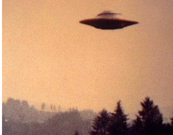
Figura 7-5. A veces Enki, salía del fondo del océano en su "plato volador" y sobrevolaba la tierra.

Esta es probablemente la forma en que pensaba, porque él hizo un montón de ajustes, trabajando duro en sus laboratorios bajo los mares. De vez en cuando llegaba a la superficie en su nave en forma de platillo y aterrizaba fuera de su palacio, o aleteaba por encima de la tierra. La gente lo reconocía porque era distinta de las naves sirias que utilizaban en la atmósfera y cuando viajaba a través de todo el sistema solar. Las naves de Sirio parecían más como aviones súper modernos, pero utilizaban la energía de punto cero y podían detenerse en el aire, al igual que podían las naves de EA. Cuando NIN-HUR-SAG se unió a él en sus laboratorios, estaba teniendo lugar un serio trabajo genético.