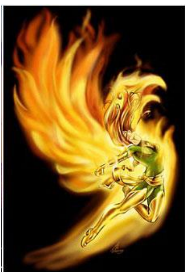
Figura 5-2. Un Fuego encendido y su Avatar

Por lo menos, dejar que nosotros los seres humanos aprendamos de esto, porque un día, si jugamos bien nuestras cartas, podremos nosotros mismos querer ser dioses creadores. Cuando llegue ese día, tenemos que tener en cuenta que con una enorme tarea que nos ocupa, viene una cantidad enorme de responsabilidad. Cada paso que damos al crear una especie necesita ser probado a través de las dimensiones para ver qué resultados probables puede tener una determinada decisión, y construir esa decisión sobre las posibles consecuencias que tendría en el futuro de la misma especie. Construir algo en el momento sin antes probar sus defectos es irresponsable y puede llevar a una gran cantidad de dolor y sufrimiento innecesario para la evolución de las especies creadas en el planeta específico que el dios creador elige trabajar.