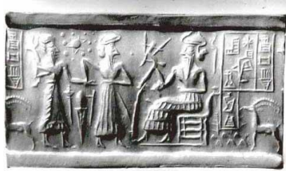
Figura 3-4. Jefe Supremo de Sirio sentado en una silla, pero aún así de misma altura que los que están de pie. Si este Sirio se pusiera de pie, él sería un gigante. ¿Es esta una interpretación correcta, o es sólo la libertad del artista para expresarse?

Muchas escrituras, aparte de la Biblia, hablan de que hubo gigantes en la tierra en estos días. Ellos fueron llamados los Vigilantes o Igigi , y eran gigantes que vinieron a la Tierra a copular con las mujeres de la Tierra. Produjeron descendencia que era tal vez más gigantesca que los propios vigilantes.