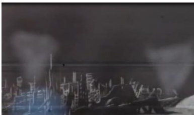
Figura 3-6. El 'Ciudad de la Luna', con sus 'Torres de la Luna' (click en la imagen para ampliar).

Algunos podrían argumentar que la Luna fue puesta allí por los dioses creadores originales (aquellos de Orión y otros lugares en todo el Universo), y otros dirán que fueron los Sirios, y que, de hecho, es una nave espacial ahuecada de Sirio.