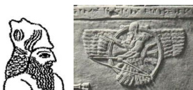
Figura 3-1 y 3-2. ENKI (izquierda) como Oannes, el 'Dios Pez', y ASHAR (derecha), un desarrollo posterior de Enlil.

Llevar nombres femeninos arios y los hacen masculinos, tal vez en un intento de insultar a la Reina y la Diosa Madre. Otros nombres para ENLIL es ZEUS, JUPITER, ASHAR, y YHVH/Yahwéh. Para simplificar, sin embargo, voy a llamar a estos dos hermanos Enlil y Enki en este nivel de aprendizaje.