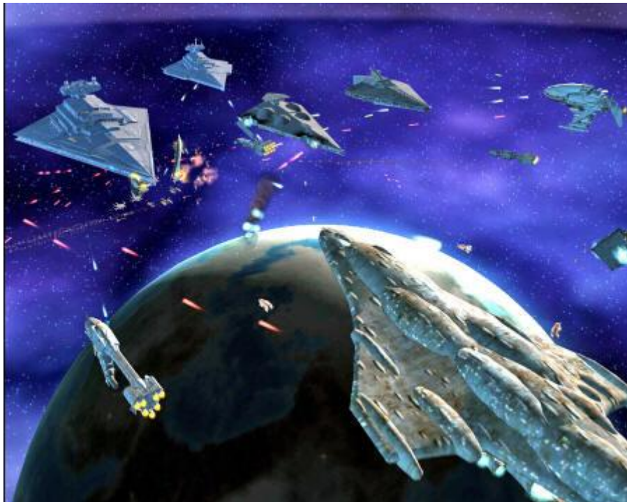
Figura 2-3 "Así que ahora, una guerra espacial en toda regla estaba en su apogeo en el espacio fuera de Terra."

Muchos se suicidaron cuando vieron que no había otra salida.