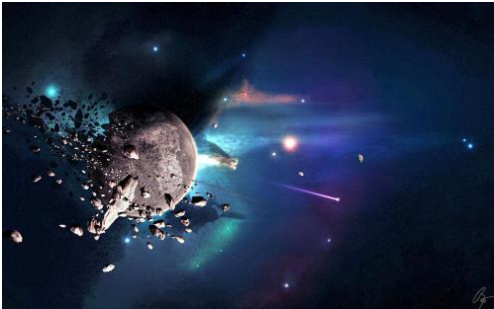
Figura 2-5 El Gran AR golpeando Terra.

Aproximadamente la mitad de ella se rompió en pequeños asteroides y rocas y más tarde se convirtió en el cinturón de asteroides, mientras que la otra mitad se catapultó en el espacio, en dirección hacia el Sol.