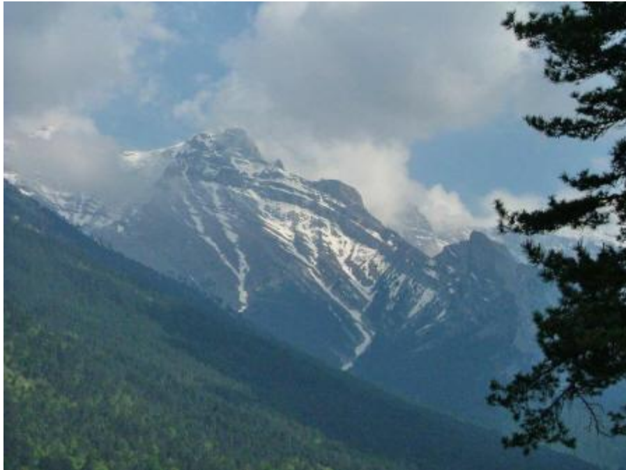
Figura 2-1 Monte Olimpo hoy, la montaña más alta de Grecia, situada en la frontera entre Tesalia y Macedonia, a unos 62 kilómetros de distancia de Tesalónica, la segunda ciudad más grande de Grecia.

En la mitología, fue una de las residencias terrenales de los Dioses.