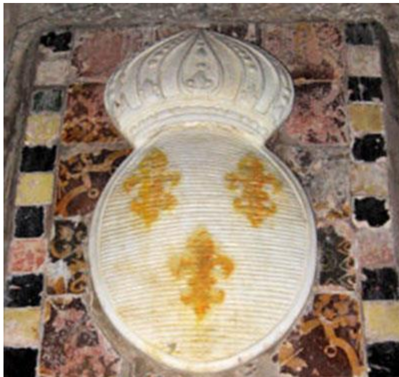
Figura 1-4 "Un tallado, adornado por una corona y con incrustaciones de oro de la flor de lis, se levanta de las baldosas. El objeto podría simbolizar una colmena, una abeja o una pupa. Los reyes merovingios francés abejas utilizadas como uno de sus dispositivos sagrados." http://www.mythicjourneys.org/newsletter_apr07_barnett2.html