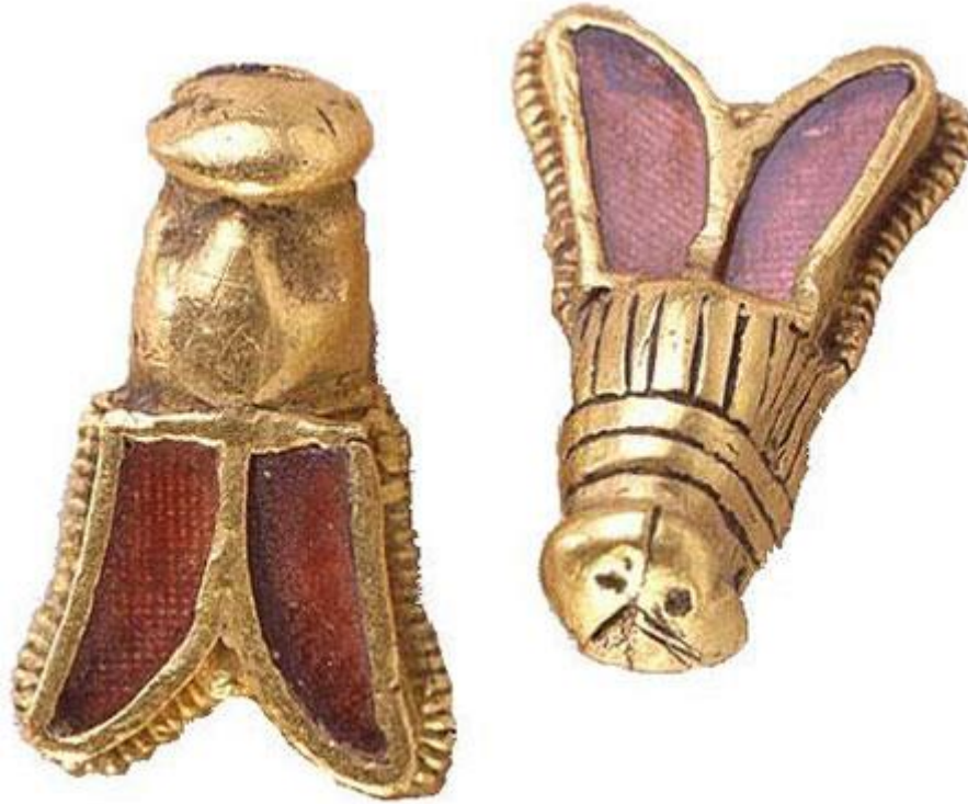
Figura 1-3 Abejas - El principal emblema de los reyes merovingios, ¿también un enlace al Imperio de Orión?