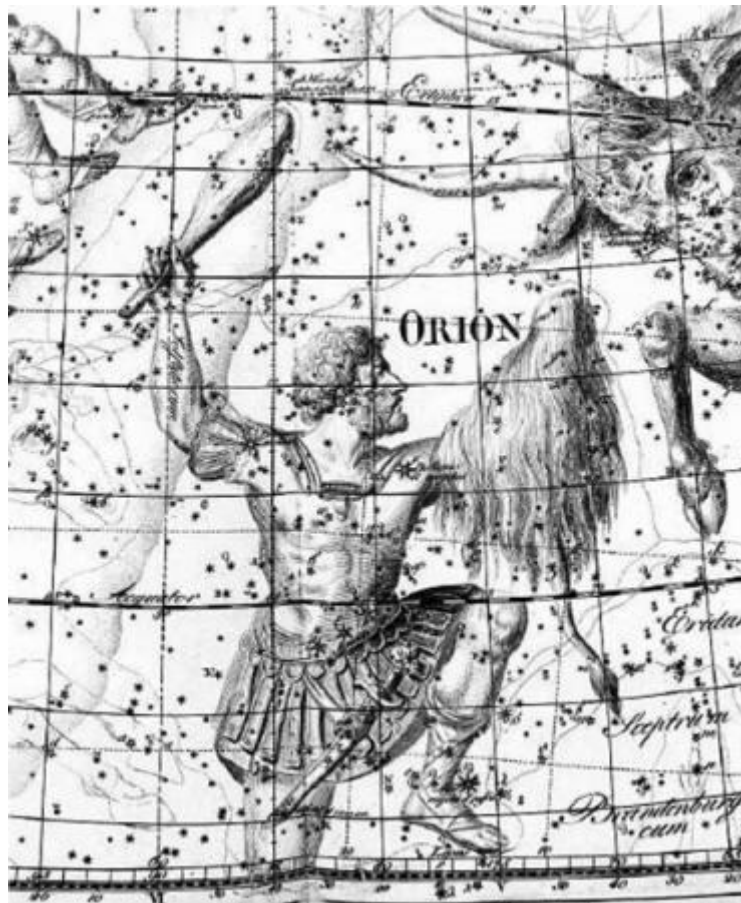
Figura 1-1 Orión, el cazador, persiguiendo al Toro

Sin embargo, esta alianza después sería rota.