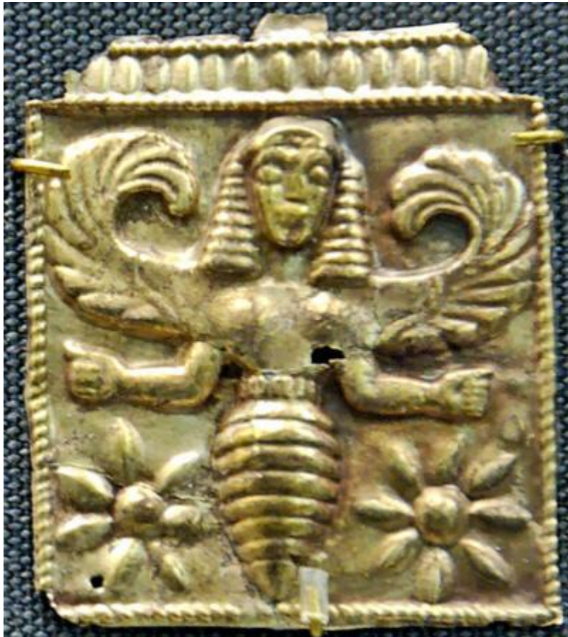
Figura 1-5 Diosa Abeja Alada

Lo mismo que en el antiguo Cercano Oriente y las culturas del Egeo, las abejas eran muy respetadas y sagradas, al igual que lo eran en Egipto en la antigüedad.