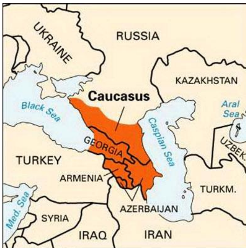
Figura 1-6 Montañas del Cáucaso

Así que hay una abrumadora cantidad de pruebas de que razas estelares del Imperio de Orión estaban aquí mucho antes de la llegada de los jefes supremos de Sirio.