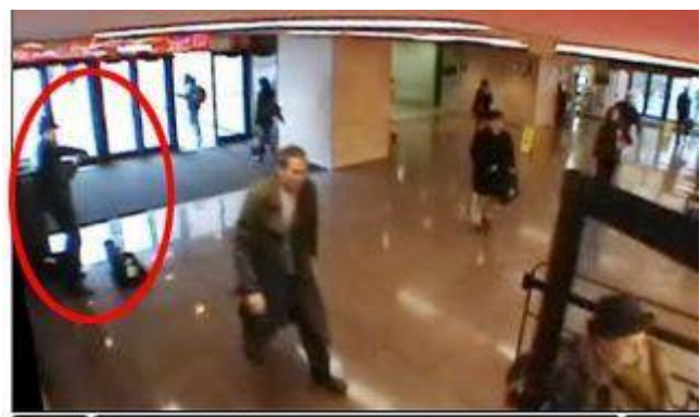
Figura 3-3. violinista, tocando a Bach

Mientras escribo este artículo, reviso mi Facebook y encuentro algo publicado por un buen amigo mío de los Países Bajos, el investigador Bart van der Zwaan. Esta imagen (Fig. 3-3) y el texto en el párrafo siguiente, nos muestran lo ocupados que somos, y lo poco que, como adultos, notamos y participamos en nuestro medio ambiente. Sin embargo, también muestra que los niños son los que todavía están más en sintonía con lo que está sucediendo a nuestro alrededor, y no tan atrapados en el túnel estrecho en el que se ha convertido en nuestra realidad: