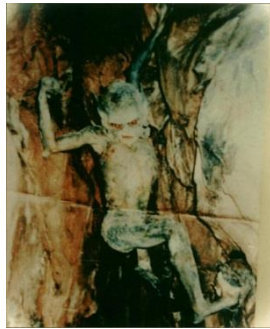
Figura 3-7. El aspecto clásico de un demonio. Esto es supuestamente una foto tomada de un verdadero demonio, que apareció en la foto y no fue descubierto hasta después se desarrolló la película. Supuestamente no era visible cuando se tomó la foto. No tengo forma de saber si se trata de una broma o no, pero la foto es intrigante (click en la imagen para ampliar).

todas ellas. La gente a menudo indica justamente cuando una persona es propensa a actos obsesivos, destructivos y muy oscuros y malvados, que él o ella está poseída por un demonio. Esta influencia del lado oscuro ha sido reconocida, no sólo por las religiones judeo-cristianas, sino por todas las religiones, a pesar de que se conocen con diferentes nombres.