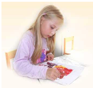
Figura 3-2. Chica, usando sus habilidades creativas

Nada de esto significa que debemos descuidar la mente consciente - es igual de importante. Tenemos que permanecer conectados a tierra aquí en la Tierra (la mente consciente) y dejar que la Mente Inconsciente surja y use eso para co-crear con la mente consciente. La mente inconsciente tiene acceso al nivel del alma subcuántica, y cuando se puede acceder a ella a voluntad, también puede fragmentarse a sí mismo y viajar a través del espacio y el tiempo