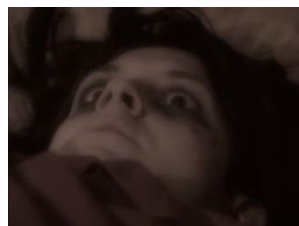
Figura 3-5. Posesión por entidad (aunque no siempre puede ser esto obvio).

La persona está actuando de una manera en un punto y en otra forma en otro punto, y esto a menudo desconcierta al medio ambiente. La gente puede encontrar a la persona poseída bastante extraña en su comportamiento, pero no pueden pensar más allá de eso.