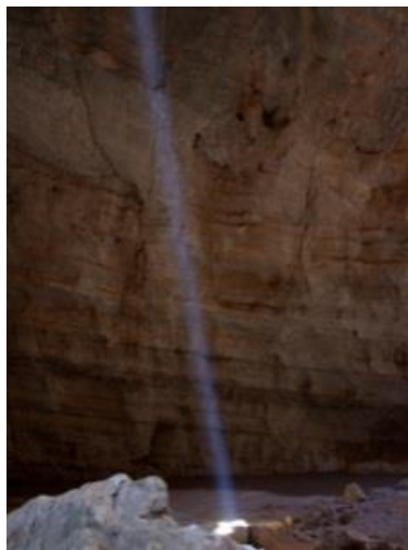
Figura 3-6. Una 'Cueva de genios'

Ellos no se preocupan por el anfitrión o el cuerpo en absoluto, pero disfrutan de seducir a una persona a la deshonestidad y el robo. Pueden hacer que al anfitrión tan disociativo y separado de sus responsabilidades diarias y obligaciones morales que son totalmente inconscientes de que algo anda mal. Ellos empiezan a ver el mundo de manera diferente de la persona promedio y no pueden creer que otros no ven lo que ellos ven.