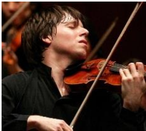
Figura 3-4. Un primer plano del maestro violinista, Joshua Bell en concierto

Si no tenemos un momento para detenernos y escuchar a uno de los mejores músicos del mundo tocando la mejor música jamás escrita, ¿cuántas otras cosas nos estaremos perdiendo?