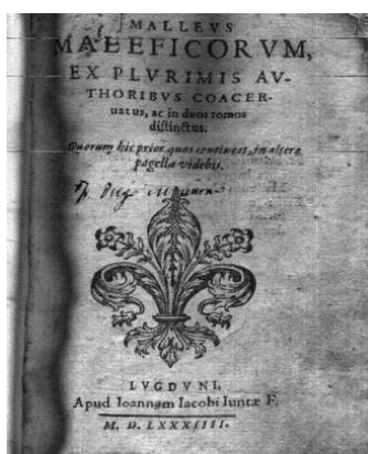
Figura 1-7. El Malleus Meleficarum, aquí fechado 1484.

Hoy en día, la caza de brujas en las mujeres ha disminuido drásticamente, pero las mujeres siguen a menudo clasificadas como ciudadanos de segunda, y en los países árabes las mujeres musulmanas deben llevar un velo, como todos sabemos, y son propiedad del hombre. Estos países nunca salieron de esto, y todavía están atrapados en el horror de la Edad Media, y en estos países, muy poco ha cambiado a lo largo de los siglos.