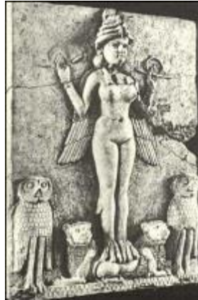
Figura 1.5. Alivio de Lilith, con alas, rodeado de búhos y leones, ambos símbolos de Diseñadores de Vida, o Kadištu [del] en sumerio.

“En primer lugar, traducimos el nombre de esta divinidad en IT-EM-U, “la fuerza metereológica”, que atestigua claramente su función creativa antes citada (creación del aire, la tierra y el cielo). Luego, su nombre griego Atum, que da AT-UM “el viejo padre-mujer”, confirmando la androginia de Atum o, al menos, el hecho de que esta entidad simboliza diferentes fuerzas creativas al servicio de la misma causa. Y, por último, el término a Ben que se atribuye a este creador ave fénix y que da BÉ-EN, “el señor que habla.” Numerosas tradiciones asimilan la palabra a la creación del mundo”. [5]