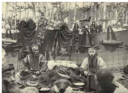
Figura 1-10. Chamanes siberianos en 1914.

Robert Morning Sky, al igual que muchas tribus nativas antiguas, equiparan el alma con ‘Fuego’, el ‘fuego interno’, que es un don del Creador, que hace accesibles las dimensiones de la diosa a los seres de diferentes realidades. Muy atrás en el tiempo, dice Morning Sky, hubo quienes practicaban ‘Ritos del Sagrado Éxtasis de la Diosa’ [19], cuando la gente vivía mucho más cerca de la Tierra y la naturaleza que les rodea. Esto los hizo mucho más psíquicos y multidimensionales, y ellos entendían el poder de la Divina Femenina. Todavía existen estos ritos en versiones un tanto aguadas entre los pueblos nativos de todo el mundo, pero incluso allí se ha perdido una gran cantidad de conocimiento en el tiempo. Los ritos de hoy, más cerca de los originales, se pueden encontrar en el Chamanismo Siberiano [20].