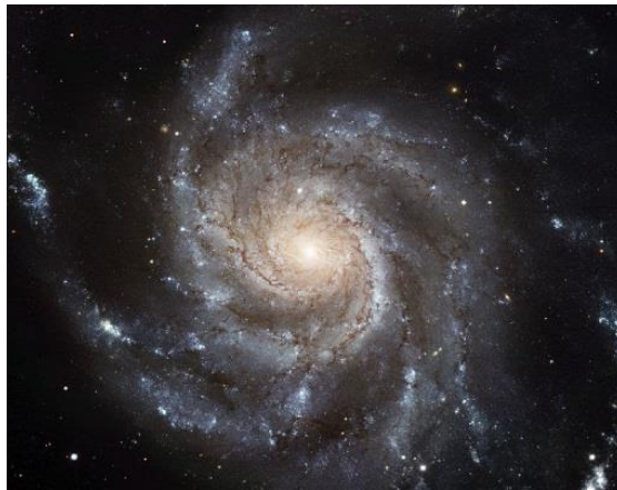
Figura 1-9. La galaxia del Molinete, también conocida como Messier 101 o NGC 5457; una galaxia espiral muy típica, situada a unos 20 millones de años luz de la tierra (click en la imagen para ampliar).

Este es un concepto bastante interesante si lo llevamos a otro nivel. Mire la siguiente imagen, (Fig. 1-9):