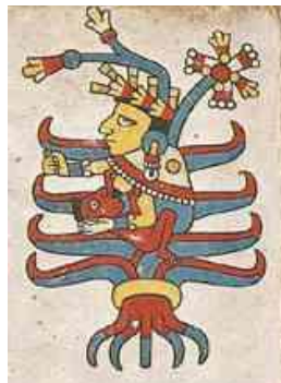
Figura 1-3. Un símbolo temprano de la Diosa Madre de la Tierra (México Codex Fejervary-Mayer, de la Plata 28)

Y desde su punto de vista, era una 'buena razón'. Antes tuvimos la visita de una raza estelar de Sirio hace unos 450,000 - 500,000 años, otras razas estelares ya habían estado aquí y todavía estaban aquí, enseñando a los seres viviendo aquí, entonces, acerca de la Divinidad Femenina. Voy a mostrar, más allá de toda duda razonable, cómo el régimen patriarcal cambió la Religión Mundial de una donde la humanidad estaba en contacto con una divinidad femenina (en su mayoría sin culto involucrado) a varias religiones diferentes, donde la humanidad adoraba 'Dioses' masculinos.