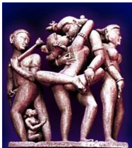
Figura 1-4. Magia sexual en la antigüedad.

Los de Orión y la mayoría de otros seres estelares evolucionados en el Universo saben que debido a que Dios es femenina, la energía femenina es más poderosa que la masculina. Además, las mujeres son más psíquicas y pueden fácilmente sintonizar con el reino de la diosa , el 96%, que es puro espíritu . ¿Y cómo hacen las mujeres esto más fácil? La respuesta es, a través del éxtasis ritual, pero más fácilmente, a través de su orgasmo.