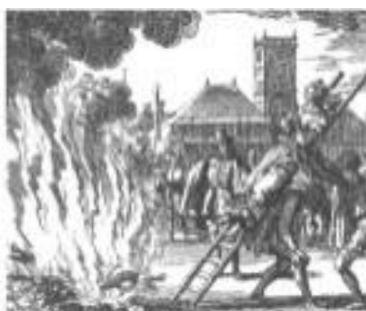
Figura 1-8. El Malleus Meleficarum en toda su posible aplicación.

Un estimado de 9 millones de 'herejes', el 80% de ellos mujeres, niños o niñas, de quienes la Iglesia pensaba que habían heredado el 'mal' de sus madres, fueron asesinados. En la Iglesia Católica medieval, las mujeres y su sexualidad eran 'el mal encarnado' [8].