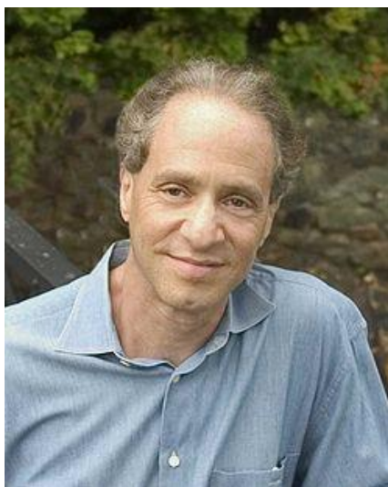
Figura 3: Raymond Kurzweil

Por otra parte, el jovencito dijo a la audiencia que él mismo había construido la computadora. Era toda una impresionante pieza de trabajo para su tiempo, pero el panel de exposición, como de costumbre, no conectó los puntos, sino en lugar de estar fascinado por lo que Kurzweil había construido en realidad, se centraron en su corta edad.