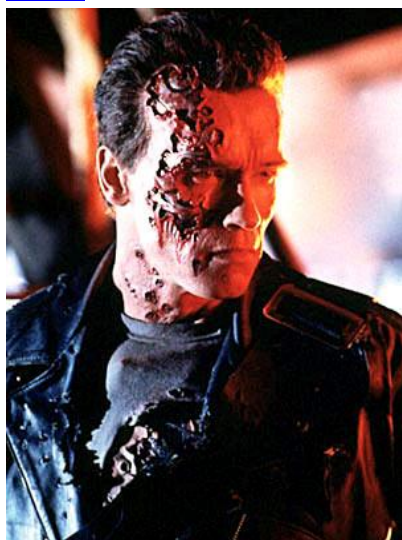
Figura 4: Arnold Schwarzenegger como Terminator

Por lo tanto, es Inteligencia Artificial (IA). Las consecuencias son obvias para el lector por ahora, pero si no es así, y si no lo ha hecho, lea mi " Libro PFD # 4: Los Animus, Inteligencia Artificial, y Tecnología de pizarra en blanco " sobre la raza Animus.