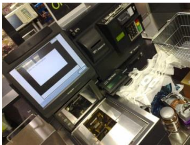
Figura 1: Tecnología de Máquinas

Esto por supuesto no es real para muchas personas hoy en día, pero es, sin embargo, lo que está previsto, que yo le mostraré. Esto no es nada nuevo. Hay extraterrestres por ahí que ya han caído en este tipo de realidad por su propia cuenta e hicieron que otros se lo hicieran a ellos. Ahora están tratando de implementar esto en la humanidad también. Más adelante vamos a discutir por qué esto es introducido. Por ahora, el control sobre la conciencia puede ser una pista.