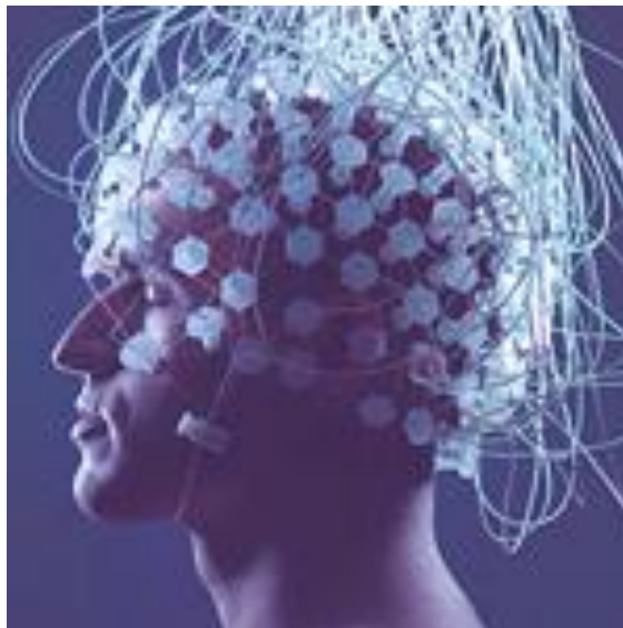
Figura 6: Visualización del Reino de Máquinas

Pero ¿cuánto tiempo? Si lo pensamos bien, realmente no importa mucho. ¿Quién quiere vivir un millón de años en el mismo cuerpo? Con una vida útil de esa manera, las cosas pueden ir mal, muy mal. Si usted tiene acceso directo a sus recuerdos de lo que pasó hace un millón de años, en su propia línea de tiempo, en la que creó ciertos eventos, usted está demasiado involucrado y afectado por cualquier situación en la que haya quedado atrapado, y a menudo intensificarla mientras se mueve más en el tiempo local. Esto incluso puede ser uno de los problemas con los Ša.AMi.