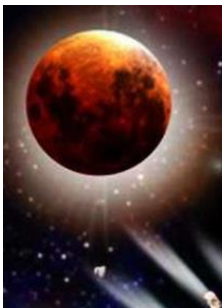
Figura 2 Nibiru y los dioses están regresando

Paz y prosperidad son ofrecidos; algunos dirán que se quedarán aquí el tiempo que le tome a la humanidad crecer y ser autosuficientes y luego se van.