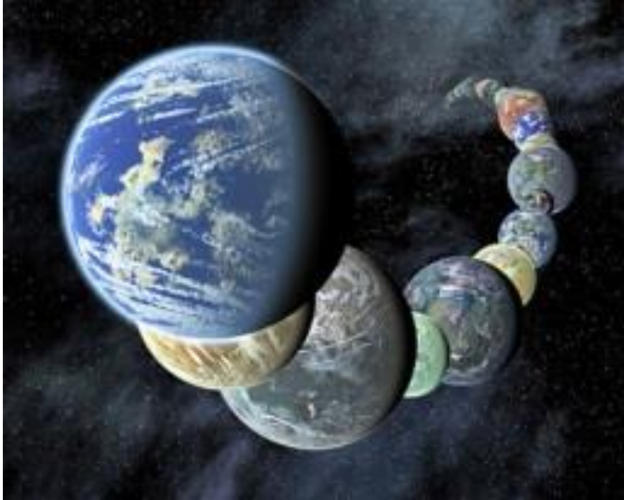
Figura 1 Toda vida en el universo es sembrada

Los textos antiguos hablan de extraterrestres, muy atrás en el pasado, introduciendo los rudimentos de la agricultura, la ganadería, enseñándonos acerca de la astronomía, la astrología y la metalurgia.