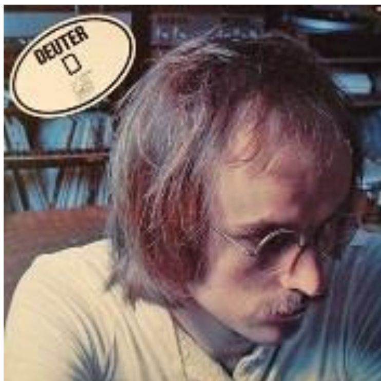
Figura 6 Deuter, alemán Compositor de Nueva Era

Es por eso que es tan importante para los Poderes Fácticos tener padres mentalmente controlados que les dicen cómo vivir dentro de la valla de frecuencia y quedan atrapados.