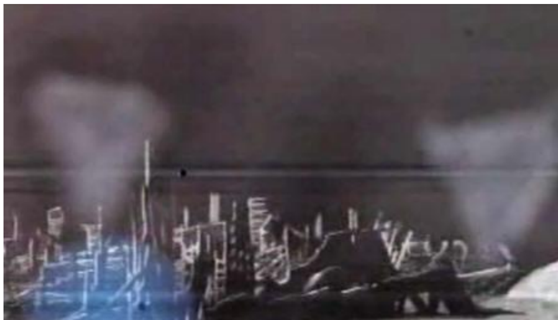
Figura 9 La "Ciudad de la Luna", ¿Un dispositivo de vigilancia Anunnaki? (video más abajo)

Sería interesante ver si podíamos encontrar un dispositivo correspondiente en algún lugar de la Tierra.