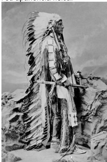
Figura 7 Indio americano vestido con plumas, recreando el aspecto de sus antiguos ancestros de las estrellas - los Pleyadianos.

Podemos ver claramente el parecido en su apariencia física.