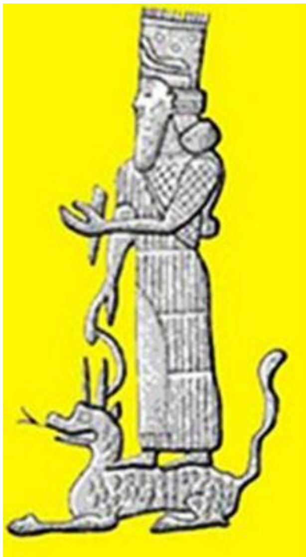
Figura 10 Nabu, hijo de Marduk

Ellos se cortaban mutuamente los penes y testículos para que los supuestos enemigos dentro de sus propias líneas no pudieran producir más en masa más; y ellos son los responsables del asesinato y el genocidio de la raza humana muchas veces.