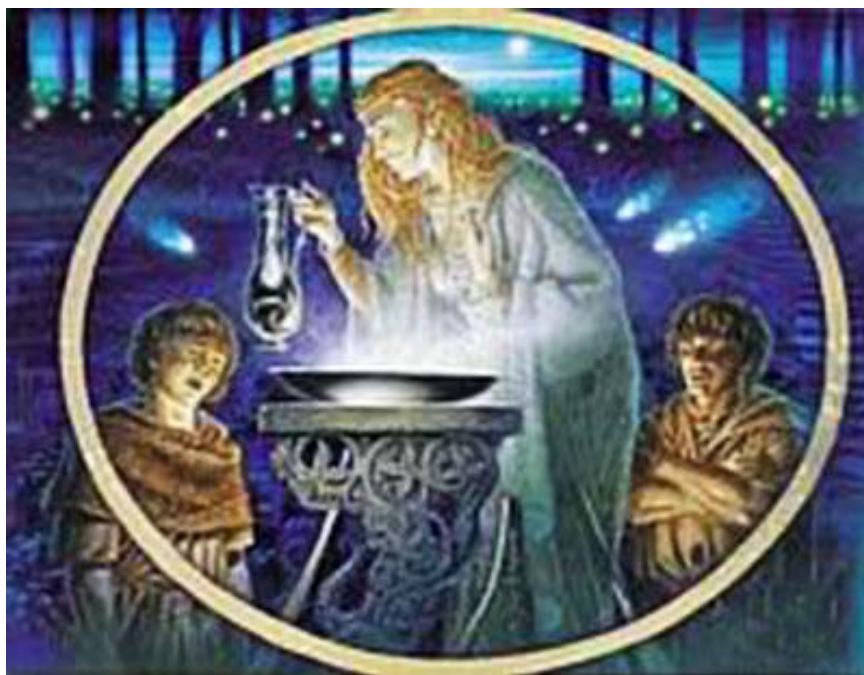
Figura 11 El Espejo de Galadriel

No quiero decir que el Dr. Bordon fue un científico, porque nunca lo fue, pero los científicos OT III especialmente, fueron capacitados en la visualización remota por L. Ron Hubbard a finales de 1960-principios de 1970 y parecían estar bien cuando desertaron de la Iglesia y fueron reclutados por la CIA y los militares.