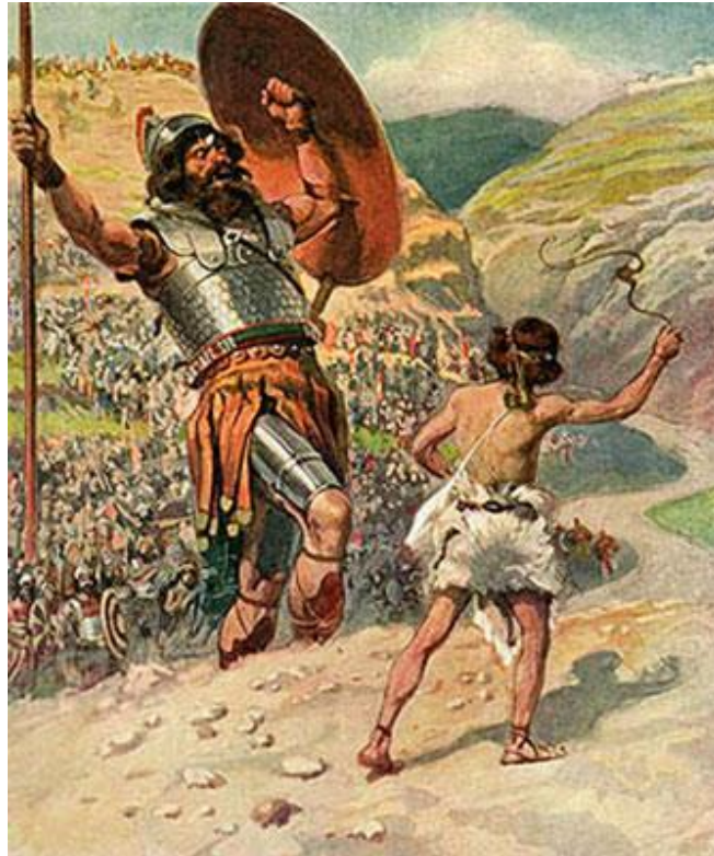
Figura 12 David y Goliat

La Era de la adoración tiene que parar .