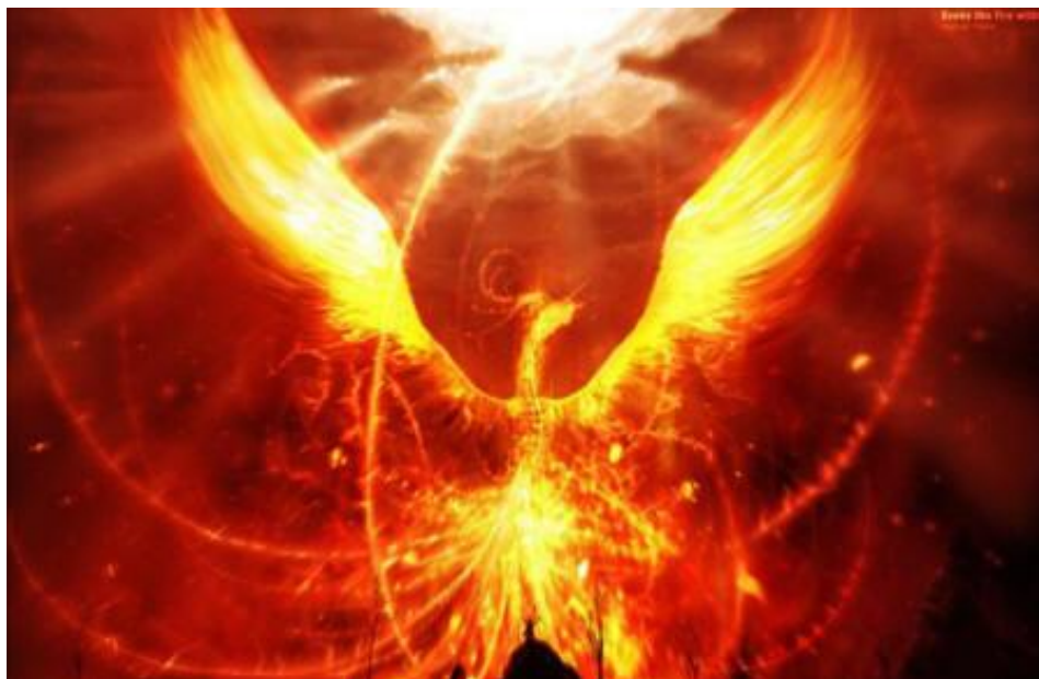
Figura 6 El Ave Fénix, que simboliza la muerte y el renacimiento

Por supuesto, todos somos seres espirituales, por lo que en realidad no podemos morir, pero nuestros biomentes sí pueden.