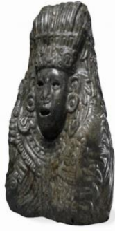
Figura 4a: Quetzalcóatl en forma humana