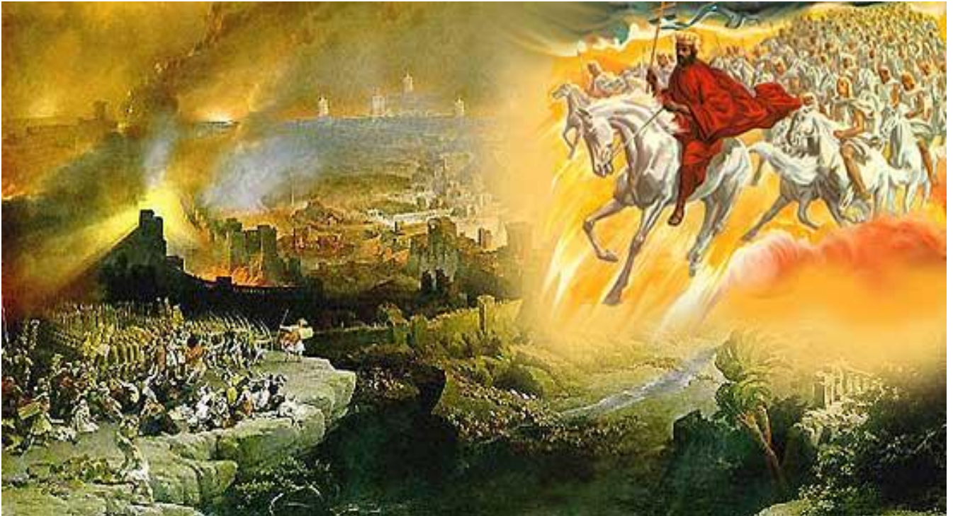
Figura 1: La batalla de Armagedón, desde la perspectiva de un artista, donde el Rey de Nibiru y sus "ángeles" bajan a combatir la "última batalla".

Marduk (equivalente a Satanás), en su orgullo cree que puede defender la Tierra contra los Señores de Nibiru. Él es muy consciente de lo que está planeado y muy ilustrado en Profecía Bíblica (después de todo, los Ša.AMi las dictaron).