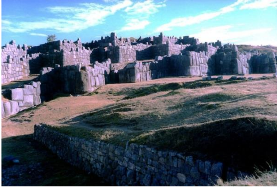
Figura 2: Sacsahuamán - Una vista lateral del complejo (click en la imagen para ampliar)