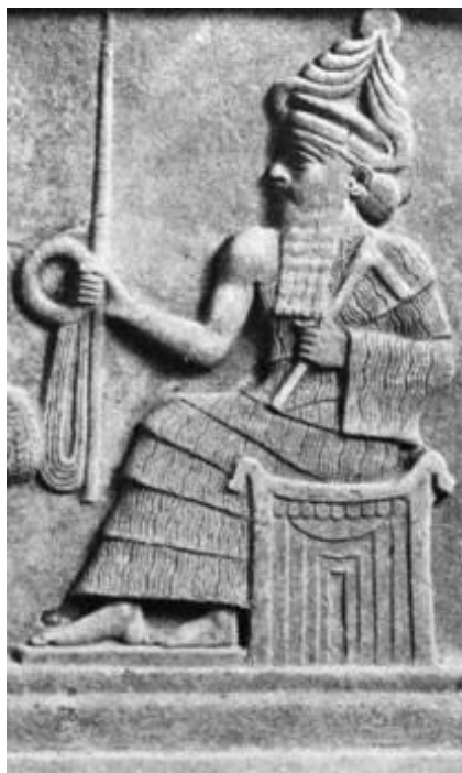
Figura: Nannar, Rey de Nibiru

En algún momento de la década de 1400 DC, el viejo rey Anu dimitió, después de finalmente tomar una decisión de la que estaba orgulloso - su sucesor sería uno de los más inesperados de todos ellos, Nannar, hijo de Nammur, el Enlil. Él fue una gran parte de la historia de la Tierra, también conocido bajo el nombre de Sin. Circunstancias de que el ex Rey Anu no había tomado en consideración le hicieron tomar esta decisión, con la ayuda de Ningishzidda, que era el que venía con la sugerencia. Ningishzidda dijo que estaba seguro de que Nannar era tal vez el único que podía unir a la gente de nuevo, y que él también tenía la fuerza de vida similar a Anu. Además, él había sido muy popular entre los terrícolas, supuestamente. Esto fue bastante un gesto inusual, porque Ningishzidda era hijo de Ankur, el Enki, y Nannar era del clan enemigo.