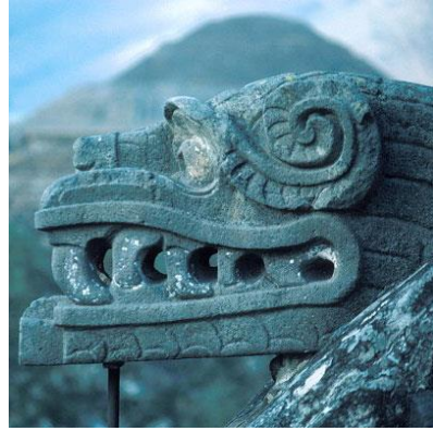
Figura 4b: Quetzalcóatl en forma de reptil

Ahora, cuando Marduk se negó a obedecer a las reglas, que se decía que había sido puesto en el equivalente a una cuarentena (común en Ša.AMicultura en estas circunstancias cuando se trata de los Lores, le dijeron). Esto no le impidió, sin embargo, y él continuó negándose a mostrar obediencia a ninguna ley y regulación importantes del Reino Ša.AMe.