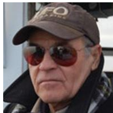
Figura 3: Bill Birnes

Durante la entrevista en History Channel le está diciendo a Copeland que Copeland es un híbrido extraterrestre. Él le dice a su colega en el video que esto es altamente controvertido, pero Birnes está diciendo a Copeland con gran énfasis y sin dudar, como si es la pura verdad, y que él lo sabe. El mismo Copeland no se sorprende, y se lo indica a él también.