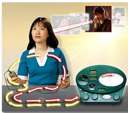
Figura i: El e-metro de la Cienciología, que también muestra las "latas" que sostiene la preclaro para emitir la corriente eléctrica a la dirección del e-metro. Esta joven está pensando en algo que le molesta; una corriente eléctrica de sus pensamientos se transfiere a través de los cables a la dirección del e-metro, y la aguja reacciona a la corriente. De esta manera, el trauma emocional puede ser localizado en la mente subconsciente del preclaro y traído a la superficie, enfrentado a través de "comunicación de dos vías", y es descargado. El resultado es que el preclaro se deshace del trauma emocional

http://wespenre.com/2/appendix-a-updates-on-remarkable-michael-lee-hill-case.htm , seguido por http://wespenre.com/2/appendix-ab-updates-on-remarkable-michael-lee-hill-case.htm ]