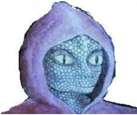
Figura 7: ¿Reptil "tipo gárgola"?