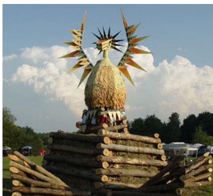
Figura 5: Del Festival Sirius Rising