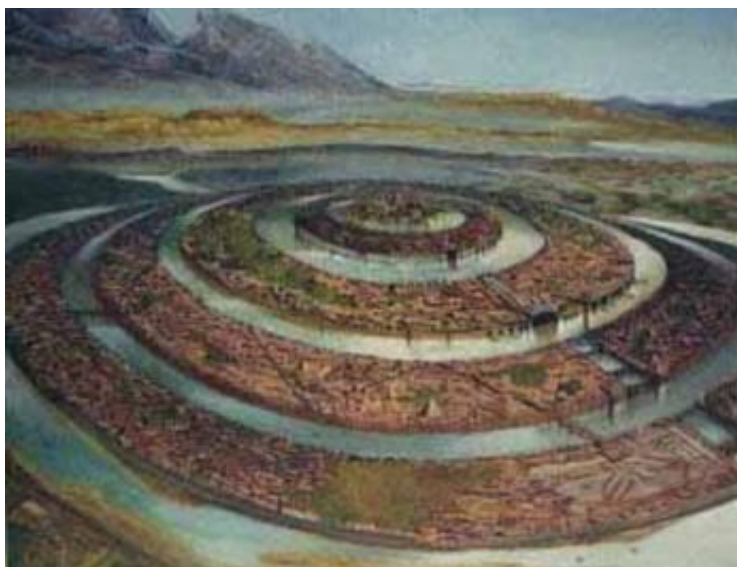
Figura 4: La Atlántida

También necesito traer a la Atlántida y Lemuria a la imagen también. Estas dos civilizaciones antiguas no fueron mencionadas en previos Artículos Anunnaki, y que no son mencionadas en el trabajo de Sitchin, tampoco. Esto no quiere decir que no existieran esas civilizaciones, sí existieron.