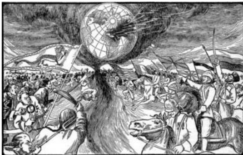
Figura 11: Visión del artista de la Batalla de Armagedón

propia gente y matar a cualquiera y todos los seres humanos que han sido asociados con Marduk y su clan. Los que optaron por el "lado equivocado" todavía tienen tiempo para arrepentirse, pero si aún no lo tienen cuando arriben las tiendas en forma de boomerang de los Ša.A.M.i., no hay tiempo para el perdón; todo el mundo asociado con Marduk y su liga será exterminado y castigado hasta la décima generación, mientras que los que han sido leales al rey de Nibiru, o evitaron ser parte del equipo de Marduk, serán "bendecidos" hasta la 1,000ª generación. Así que el castigo para aquellos directamente involucrados será la pena de muerte. La única restricción que la ley Ša.A.M.i. tiene sobre la pena de muerte es que un Señor no debe matar a otro Señor (rara vez sucede) y un rey nunca mata a un señor; algo inaudito. Sin embargo, la gente de rango inferior, tanto en Nibiru como aquí, parece que pueden conseguir la pena de muerte. Se ha hecho mucho en el pasado y se describe en los libros de Sitchin, y todavía está siendo ejecutado en el planeta de origen.