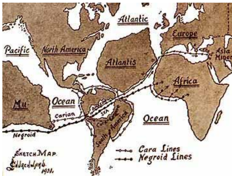
Figura 5: Antiguo mapa del mundo, incluyendo la Atlántida y Lemuria (Mu)

En los libros de Sitchin suena como si la Tierra es el único planeta que los Ša.A.M.i. visitaron, y pudieron hacerlo porque se acerca a la Tierra cada 3600 años (un SAR). Sin embargo, esta especie no está atascada en 3-D y puede viajar interdimensionalmente y están utilizando portales estelares y puentes Einstein-Rosen para ir de un punto en el universo a otro. Esta es la forma más fundamental de viajar a través de largas distancias en el espacio/tiempo. Los Ša.A.M.i. son guerreros y una raza conquistadora, y han invadido otros planetas, tanto antes como después de la Tierra, como veremos en el "Segundo Nivel de Aprendizaje".