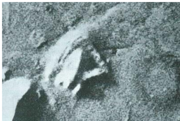
Figura 7c: edificio con estructura de ángulo recto en Marte