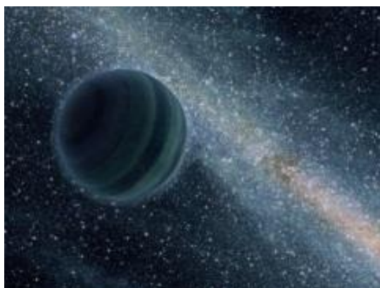
Figura 2: Planeta Huérfano

Otra razón para dar crédito al trabajo de Sitchin es porque los dioses todavía están aquí, y los del planeta (Nibiru) están regresando en su ciclo de 3,600 años, aproximadamente alrededor de 2060 - 2095. Más sobre esto más adelante. Ya he mencionado que el grupo el LPG-C stá en contacto directo con los Nibiruanos, pero no son los únicos. Hay más personas que han tenido encuentros cercanos cara a cara (Encuentro cercano de la quinta clase) con estos seres, algo que también vamos a cubrir en profundidad más adelante.