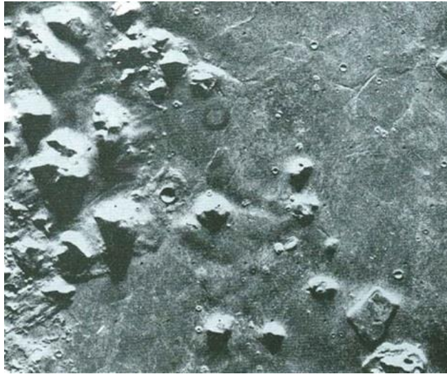
Figura 7a: Cydonia - La cara de Marte y alrededores

Las fotografías de las que está hablando el Sr. Sitchin son las siguientes. Como de costumbre, haga clic en las imágenes para ampliarlas: