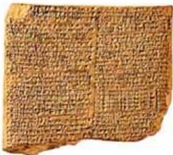
Figura 1: Una Tablilla de Arcilla sumeria

Los sumerios fueron capaces de escribir lo que les estaba ocurriendo en su propia vida y tal vez un par de generaciones atrás y aun así lo escribieron de manera precisa, pero cualquier cosa que vaya más atrás es un rumor. En otras palabras, cualquier cosa que sucedió antes les fue contada a ellos por los propios Anunnaki. Esto significa que podría haber sido alterado para adaptarse a los dioses. Después de todo, ellos querían asegurarse de que los humanos les respetaran y siguieran sus órdenes. Algunas de las tablillas también podrían haber sido escritas por ellos, o por escribas humanos, con la intención de inducir al error. Aquí todo es posible, así que por favor mantenga su mente muy abierta cuando usted siga leyendo: