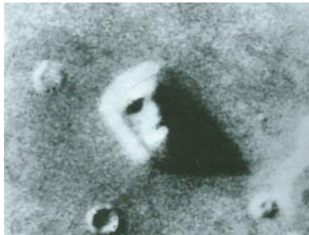
Figura 7b: La cara de Marte (acercamiento)