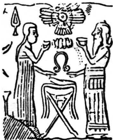
Figura 2: Ninmah y Ea creando trabajadores cigoto

El pequeño parecía 'arcilla de tierra, su piel era de color rojo oscuro y su cabello era de un color negro cuervo, contrariamente a los Ša.AMi, que eran de raza blanca, con el pelo rubio y ojos azules. Otra diferencia entre los cuerpos de Sirio y este nuevo híbrido era que los sirios nacían sin prepucio alrededor de sus penes. Este híbrido tenía un prepucio. Ea pensó que era bueno, ya que actuaría como una distinción entre ellos y esta nueva raza híbrida. Él decidió que debían dejar que el prepucio permaneciera.