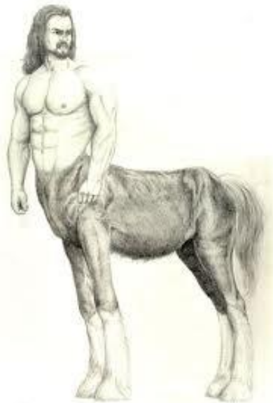
Figura 1: "Centauro" - un cruce entre Anunnaki y caballo

Ahora, habiéndosele dado manos libres por el rey Anu, Ea y Ningishzidda inmediatamente continuaron sus experimentos genéticos para crear el 'trabajador ideal'. Antes de que incluso llegaran cerca del resultado final, trataron diferentes opciones. Las criaturas más sorprendentes fueron creadas, como el Centauro , que era un cruce entre Anunnaki y caballos salvajes, en un intento de crear el caballo de trabajo perfecto, fuerte e inteligente. Ese proyecto fue abandonado, pero aquí es de donde viene el mito sobre los Centauros.