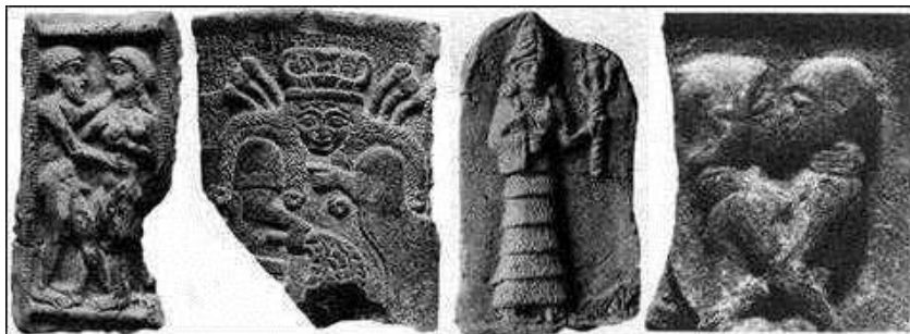
Figura 5: Ea embaraza a dos hembras humanas, que luego dieron a luz un hijo y una hija, respectivamente; Adapa y Titi. En la segunda tabla de la izquierda vemos a Damkina sosteniendo a Adapa y Titi. La tercera tableta está más probablemente mostrando Damkina sosteniendo su favorito, Titi. En la tablilla a la derecha, Adapa y Titi están apareándose, lo que lleva a Titi dar a luz a Ka-in y Abael (Cain y Abel).

los Anunnaki. Nammur, que ya estaba enojado con Ea por haber creado esta especie, ahora exigió a su hermano que llegara a ideas para poner fin a la escasez de alimentos y al rápido crecimiento del número entre la raza de esclavos.