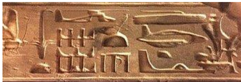
Figura 7: Un helicóptero en la parte superior y otras lanzaderas y vehículos espaciales se puede ver claramente en este extraordinario tablilla!

Hace 13,000 años, la capa de hielo en la Antártida se deslizó. La Fuerza de la Rejilla de Nibiru la puso en el Mar del Sur y a medida que se derretía, impulsada hacia el norte, el agua comenzó a correr a 650 millones de pies cúbicos por segundo. Las tormentas azotaron y el agua se levantó rápida matando a todo a su paso, excepto para el arca de Utnapishtim, que flotó sobre las olas durante cuarenta días y cuarenta noches, hasta que se quedó atascada en la cima del Monte Ararat. Allí ofrecieron un cordero para Ea, Ea y Nammur y bajaron a reunirse con ellos en "torbellinos", algo parecido a los helicópteros modernos ( fig. 7 más abajo ).