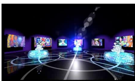
Figura 2 - visión del Artista de una Zona Tributaria galáctica

Los miembros de Enseñanza Lyricus Orden, en el WingMakers Story ( http://wingmakers.com ) son embajadores ante las Tribus de Luz. La filosofía básica de los WingMakers y la Orden de Enseñanza Lyricus es que hay 7 superuniversos, como nos enseña la lectura de los documentos de Urantia [11] . Cada superuniverso tiene su propia Zona Tributaria; por lo tanto, 7 Zonas Tributarias todas juntas. Existen estas Zonas Tributarias como lugares de investigación y difusión de conocimientos, tal vez como otra 'terminación nerviosa' del pensamiento de superdominios, donde están contenidos la totalidad de los Registros Akáshicos. Entonces, como la Orden Lyricus dice, la zona colocada en cada galaxia contendría más específicamente los Registros Akáshicos de una galaxia en particular, y todo lo que ha sucedido dentro de ella desde su creación hasta su cumplimiento. Es como la exportación de una parte de una gigantesca biblioteca.