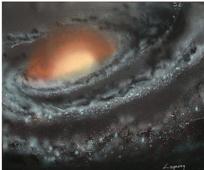
Figura 1 - perspectiva del artista de una galaxia con su Sol Central, donde se encuentra la Zona Tributaria.

Dentro de la galaxia hay una Zona Tributaria, que es un 'planeta' sintético que está diseñado para albergar el sistema de conocimientos apropiado para las especies de dicha galaxia en particular. Lyricus utiliza estas Zonas Tributarias como centros de investigación y formación en el que sus maestros pueden recopilar la información, traducirla en los formatos culturales o científicos indígenas de la especie, y luego exportarlo a una especie planetaria específica. [10]