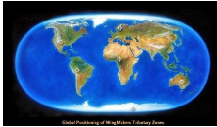
Figura 3 - Posicionamiento Global de Zonas Tributarias WingMakers

Estas 7 Zonas tributarias son lugares reales, a pesar de lo que a veces se ha dicho, incluso en el sitio WingMakers, y están aparentemente estacionadas en donde está indicado en la figura 3, y se supone que estos sitios han sido encontrados y explorado, uno por uno, y decodificados y revelados a la raza humana cuando estemos listos. Hasta el momento, sólo el sitio en Nuevo México sido oficialmente localizado (ver Wingmakers.com). El propósito original del sitio WingMakers era para que miembros encarnados de la Orden de Enseñanza Lyricus ayudaran a localizar y decodificar el material, que en su forma original fue exportado desde altos Niveles de Conciencia # y no en un idioma conocido a ninguna especie en la galaxia. Cada Zona Tributaria, en cada planeta, necesita ser decodificada para poder ser comunicada en uno o más idiomas que se hablan en el planeta en cuestión, de acuerdo con los WingMakers y LPG-C.