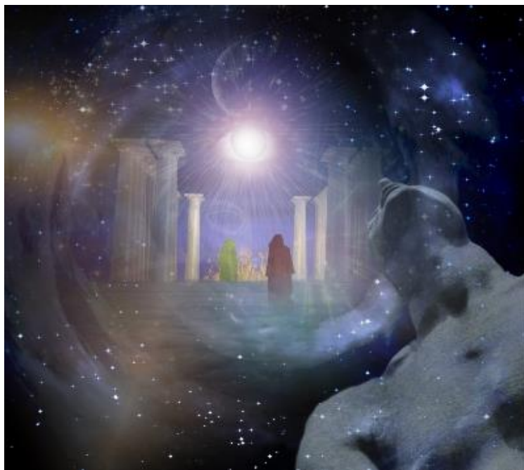
Fig. 1: Las dimensiones astrales.