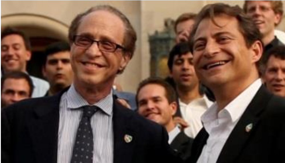
Fig. 5-2.: Dr. Ray Kurzweil (izquierda) y el Dr. Peter H. Dimandis (derecha), Fundadores de la Universidad de la Singularidad En el fondo vemos lo que parecen ser estudiantes felices y dedicados.

espaciales! ¿Es por esto por lo que los "proyectos de divulgación" en el movimiento OVNI están abogando detrás de las escenas? Ciertos voceros dinámicos para este tipo de proyectos de divulgación en la comunidad OVNI son ciertamente muy educados, gente inteligente, ¿por qué no tenerlos (según mi conocimiento) en organizaciones tales como la mencionada empresa Zero Gravity Corporation y revelar quién está detrás de él y cuál es su agenda?