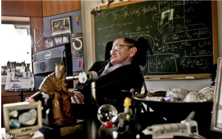
Fig. 5-1: Dirigido por el Astrónomo Real Lord Rees, pensadores famosos, como el físico Stephen Hawking (en la foto) y el ex jefe científico Robert Gobierno Han formado el Centro Cambridge para el Estudio de Riesgo existencial (RSME) para elaborar una lista del fin del mundo de riesgos que podrían acabar con la humanidad.

Hawking y un grupo de colegas de diecisiete de los más brillantes científicos de la Universidad de Cambridge han formado una organización llamada Centro de Cambridge del Estudio de Riesgo existencial (RSME), y su objetivo es reconocer las amenazas que pueden acabar con la humanidad si pasaran desapercibidas, según un artículo publicado en el Daily mail el 12 de septiembre de 2013. [1] Es tarea de estos científicos ponerse sus gorras de pensamiento. Luego, con un esfuerzo conjunto, ellos, con suerte, llegarán a ideas para salvaguardar la raza humana y resolver problemas en el horizonte en nuestro nombre. El artículo compara estas mentes brillantes con "super-héroes".