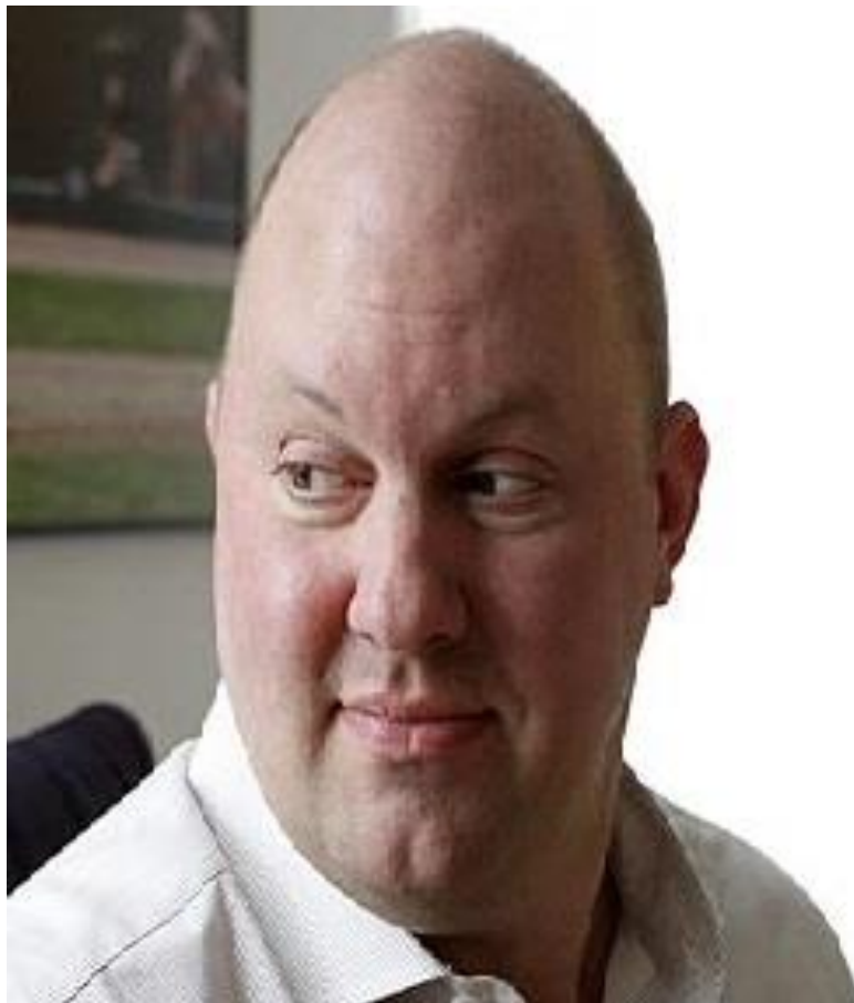
Marc Andreessen, IdIC.

Un informe de Accenture este año estima que este nuevo Internet industrial de las Cosas - que también ha sido llamado la cuarta revolución industrial o Industria 4.0 - podría impulsar la economía británica por $ 531bn (£ 352bn) en 2030. [39]