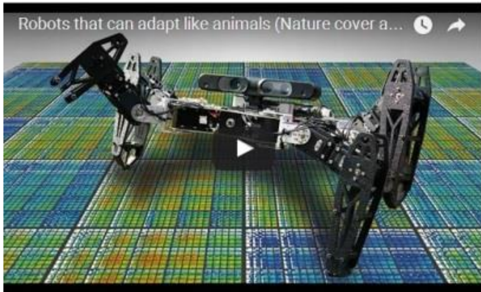
Multimedia 5-2: El algoritmo Inteligente de Prueba y Error introducido en el documento 'Los robots que pueden adaptarse como los animales' (Nature, 2015), el video muestra a dos robots diferentes que pueden adaptarse a una amplia variedad de lesiones en menos de dos minutos.

En un artículo publicado en Sputniknews.com el 28 de mayo de 2015, se nos da una "vista previa" en el video siguiente, de lo que está por venir.