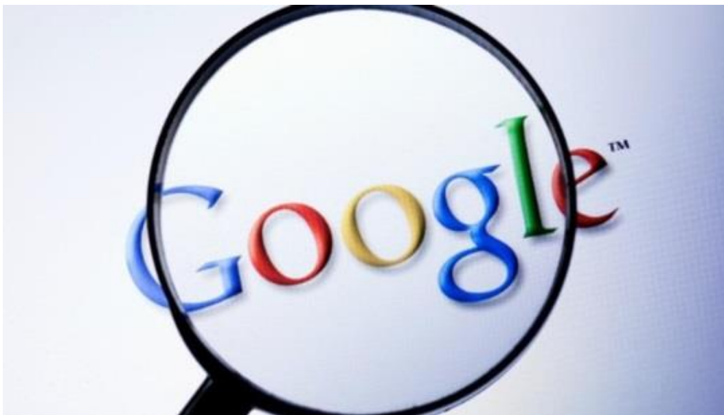
Fig. 5-3: Google bajo la lupa.

Hemos discutido anteriormente que cuando la humanidad se convierta en ciborg, será más o menos inmortal, pero el término ciborg indica que van a ser a la vez biológicos y artificiales. El controlador no tendrá ningún problema con el mantenimiento de la parte artificial "viva", pero ¿qué pasa con la parte biológica?