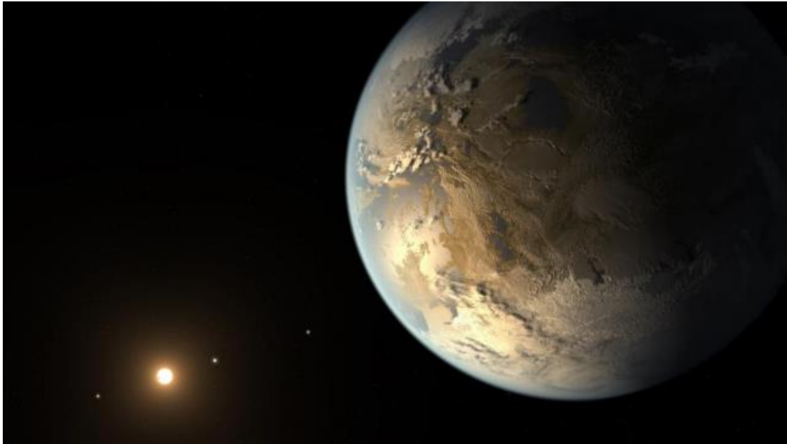
Fig. 5-7: Interpretación de un artista de Kepler-186F, un potencial exoplaneta similar a la Tierra

Vamos a irnos de la Singularidad en el hogar a la Singularidad en el espacio. Ahora ya sabemos que nuestro sistema solar no es único, que hay otros sistemas solares por ahí con sus propios exoplanetas. Algunos de ellos han sido encontrados en órbita alrededor de estrellas que son muy similares a nuestro Sol, y que orbitan alrededor de la misma distancia que la Tierra alrededor del Sol, y algunos de ellos parecen ser de un tamaño similar.