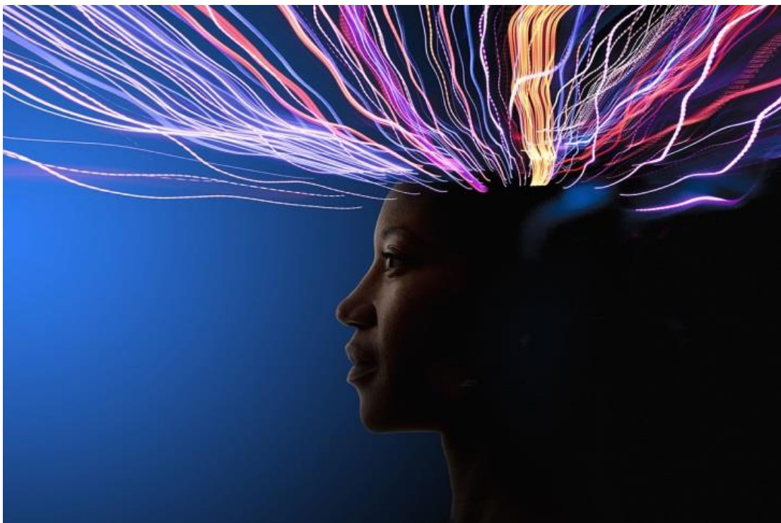
Fig. 5-6: Conectado!

El científico escribió en julio de 2015, cómo la ciencia está en el proceso de creación del Súper Cerebro de Computadora, y que ya han probado exitosamente este principio de monos y ratas. [33] Ellos llaman al SCC el Red Cerebral (Red Cerebral) , que es un término bastante adecuado. Traigo este artículo a su atención, ya que demuestra cómo los controladores están imaginando el SCC y la versión futura de la humanidad.