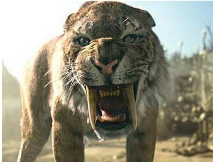
Fig. 13-2: El gigante Smilodon (tigre dientes de sable)

En su libro, el Dr. Kurzweil revela que él considera muy interesante, no sólo que los científicos hoy en día estén trabajando en la clonación de animales de especies en peligro, con el fin de evitar que se extingan, sino que también están trabajando en re-crear especies que ya se han extinguido . [21] ¡Aquí es realmente donde la ciencia se ha vuelto loca! Una vez puedan hacerlo (y yo creo que ya pueden hacerlo y lo están haciendo ), es cuantas especies quieren revivir? ¿Dinosaurios? ¿El Smilodon (el tigre dientes de sable)?