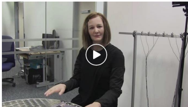
Multimedia 13-3: robot emocional, "clonado" de su creador (como es arriba, es abajo).

Nadine , en el vídeo de arriba, que es "clonada" de su creador, un destacado científico I.A., es todavía bastante mecánica en sus respuestas y emociones, pero no pasará mucho tiempo antes de que se subsana ese "defecto", tomando en cuenta la investigación de Mad Max.