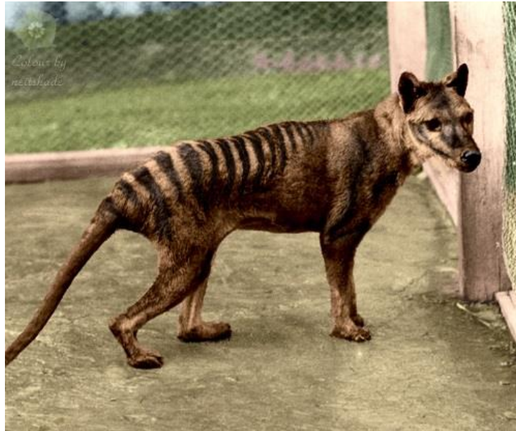
Fig. 13-3: El último tigre de Tasmania, que murió en cautiverio.

También quiero hacer hincapié en que cuando mencioné a los dinosaurios y el Smilodon, probablemente no estaba exagerando. De hecho, el Dr. Kurzweil nos dice en su libro que en 2001, los científicos fueron capaces de sintetizar ADN del tigre de Tasmania, ya extinto, y tienen la esperanza de traer esta especie de vuelta a la vida. [22] Kurzweil en realidad escribe que si pudieran, probablemente revivirían también a los dinosaurios. [23] Incluso si una especie animal fuese cazada por los seres humanos, hasta su extinción, la naturaleza ahora se ha ajustado a un entorno en el que esa especie en particular está vacante, y revivirla, quizás 80-100 años más tarde, va a crear resultados no-deseados. Además, como ya he dicho, las especies extinguidas se han "trasladado" a otra versión de la Tierra. Por lo tanto, ninguna especie jamás se extingue; sólo cambia de realidad.