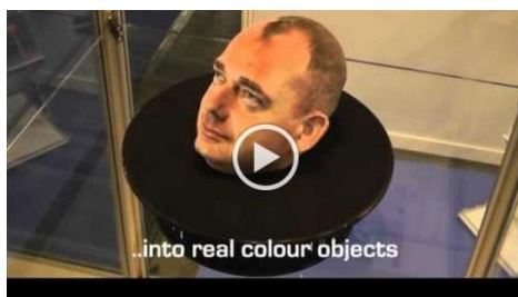
Multimedia 13-4: impresión de seres humanos en 3D.

Una cabeza, como la de la imagen de arriba, se puede crear a partir de una imagen de usted mismo, que es colocada en el software adecuado y se imprime. ¿Esto significa que cualquier persona en el futuro puede clonarse a sí misma en tantas copias que él o ella desean? Tal vez la persona no quiere ir a una fiesta y envía un clon en su lugar?