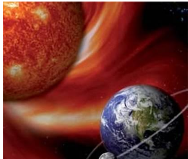
Abb. 3 - Künstlerische Interpretation von Nibiru, wie er die Erde in kurzer Distanz

Die Plejadier sagen etwas sehr Ähnliches. Nochmal, es ist nicht entscheidend, was andere Leute oder kollektive Entitäten sagen. Was wichtig ist, ist, was du fühlst und ob das, was du lernst