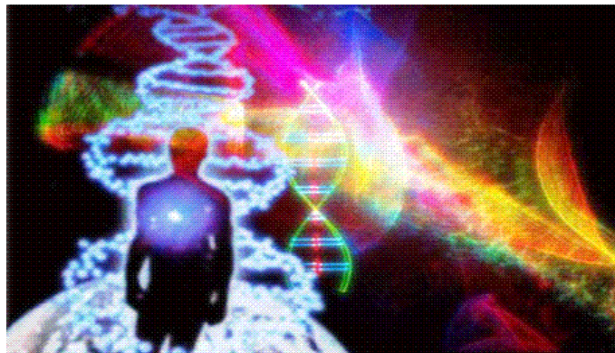
Abb. 1 - Aufstieg durch DNS-Aktivierung

Unser unmittelbares Ziel ist die Weiterentwicklung unserer unendlichen Potenziale und zudem zu begreifen, dass wir nicht multidimensional werden, sondern es bereits sind. Und das ist dann bereits ein Spiel in einer ganz anderen Liga.